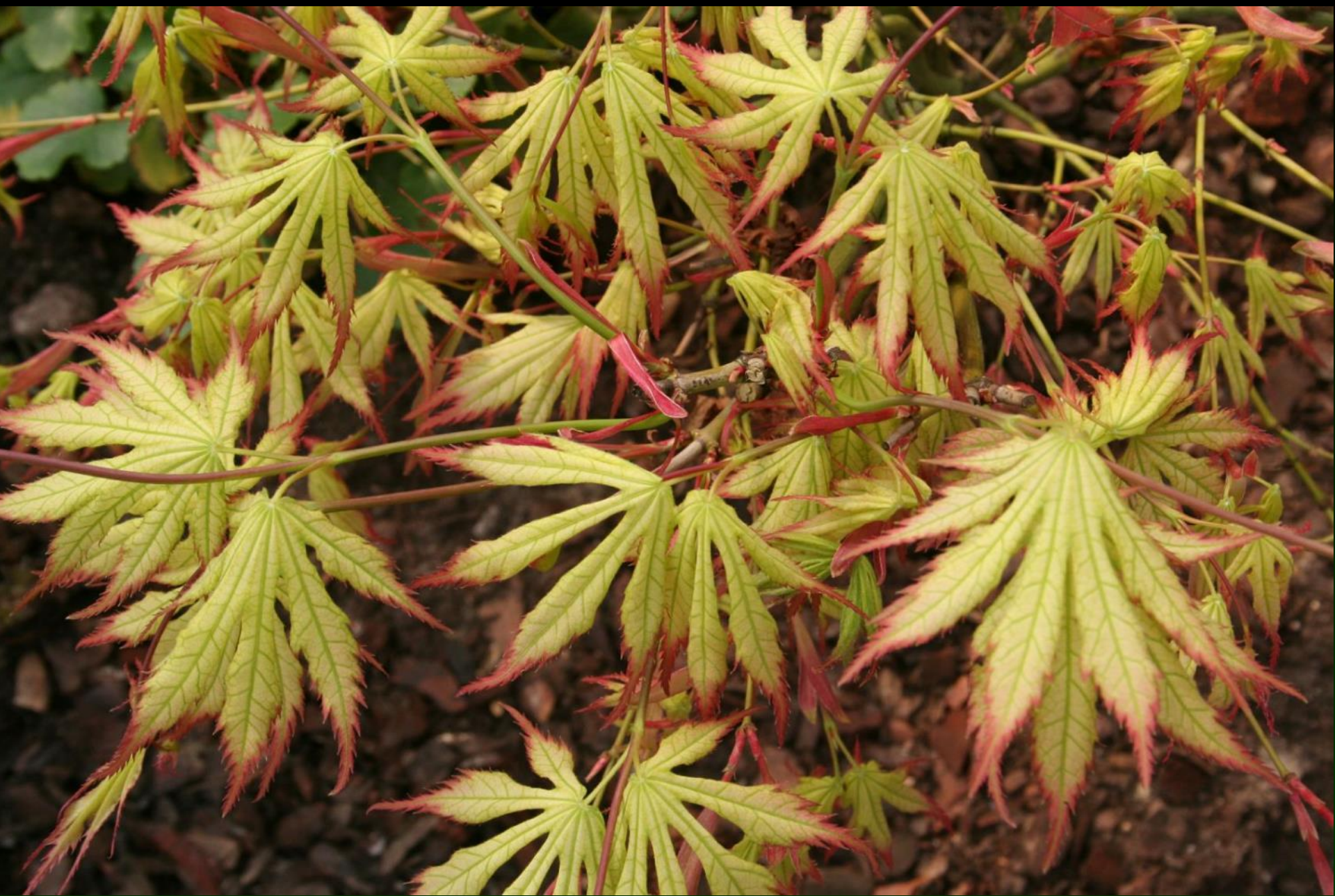
Acer palm. 'Peaches and Cream'