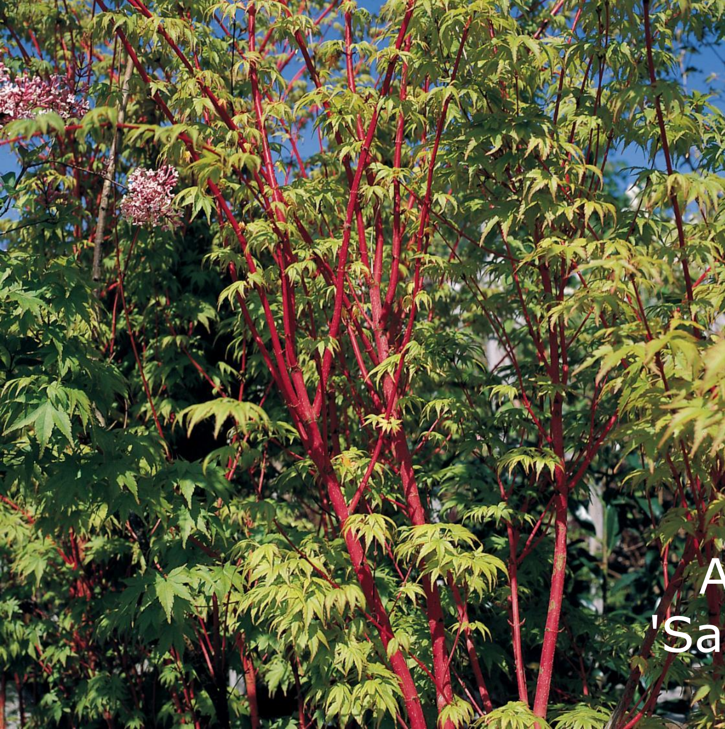
Acer palm. 'Sango kaku'