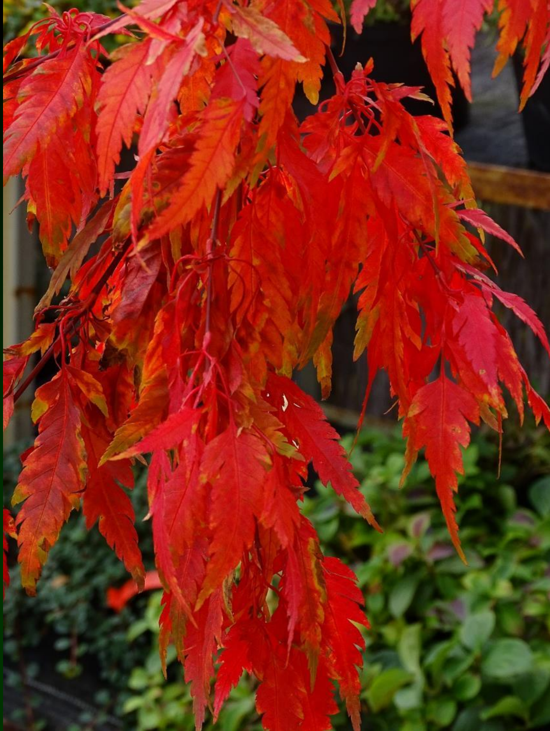
Acer palmatum 'Beni hageromo'