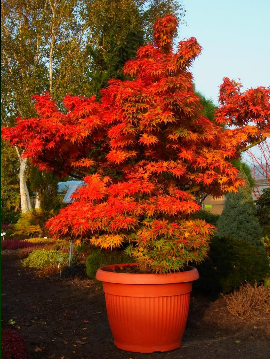
Acer palm. 'Mikawa yatsubusa'