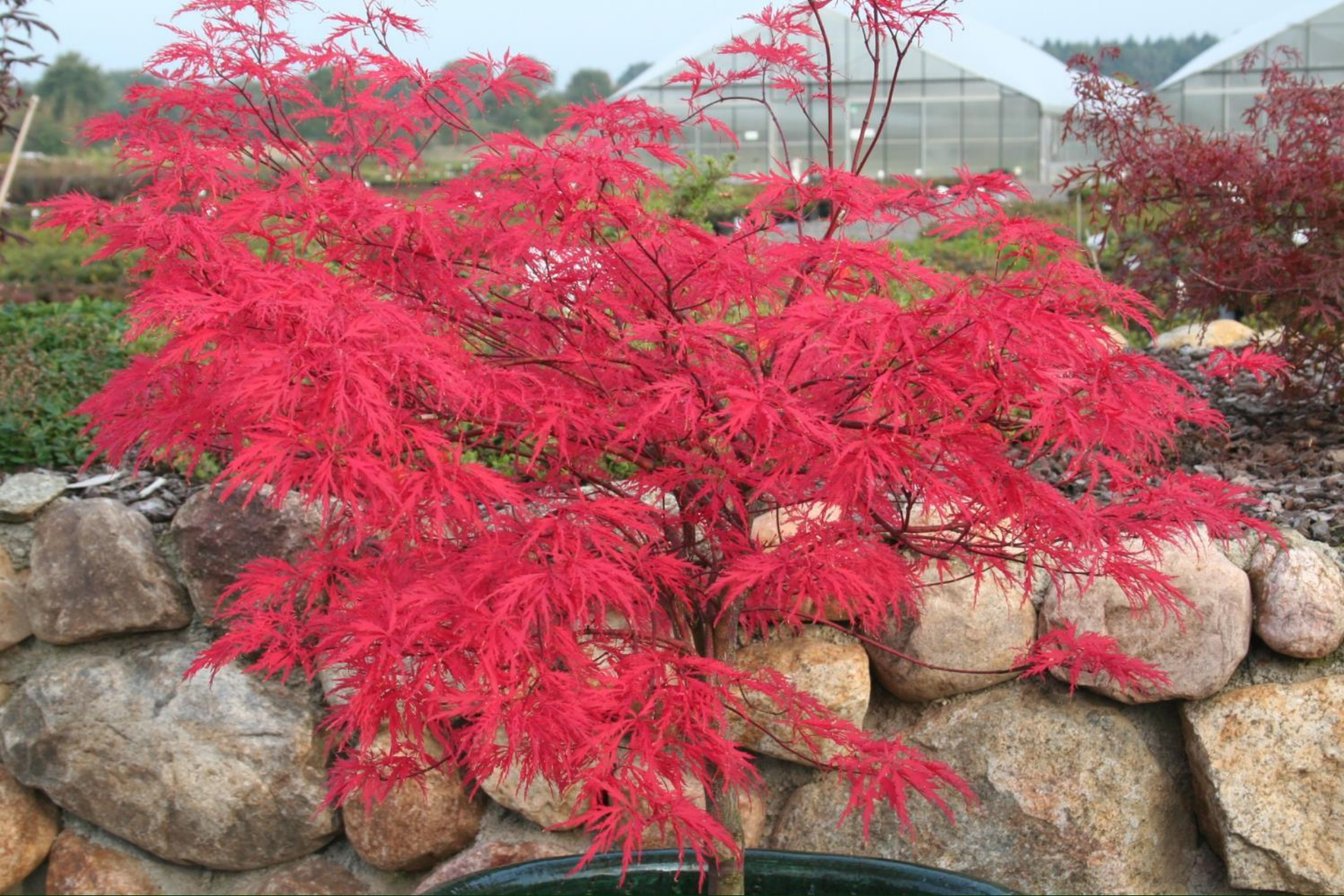
Acer palm. 'Baldsmith'