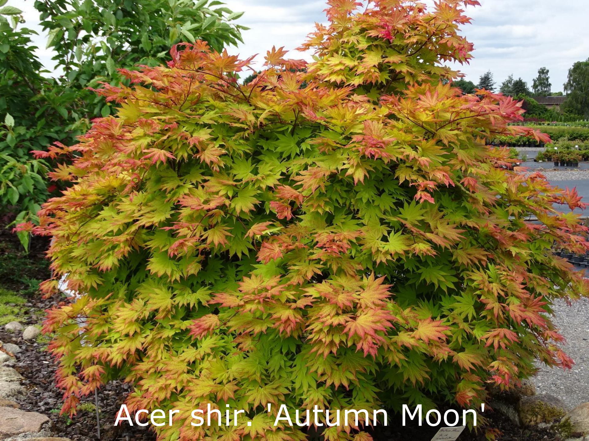
Acer shir. 'Autumn Moon'