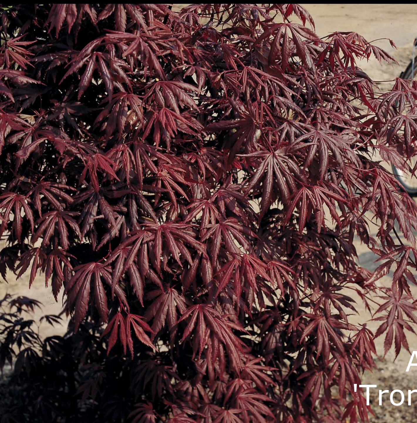
Acer palm. 'Trompenburg'