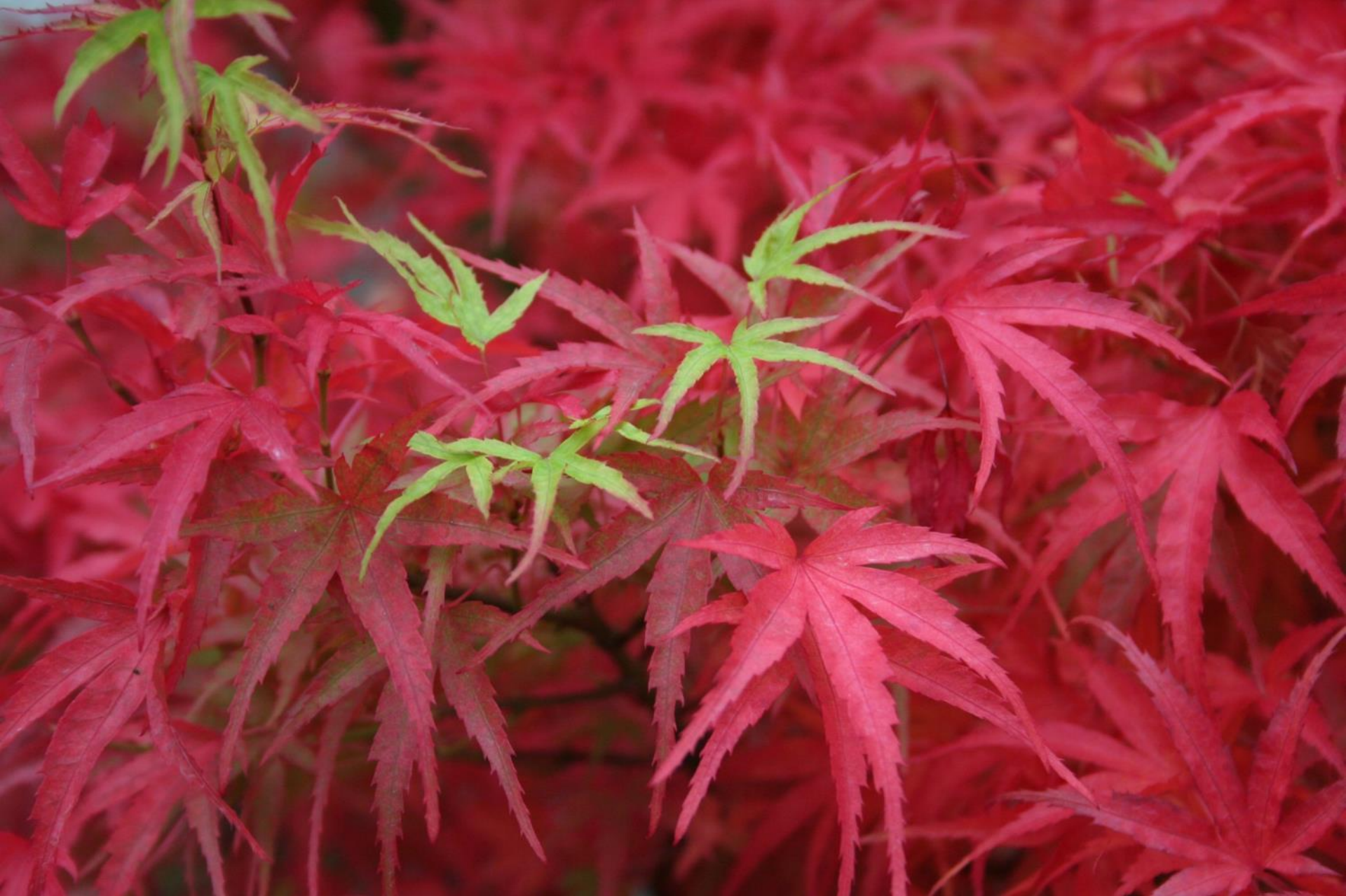
Acer palm. 'Kamagata'