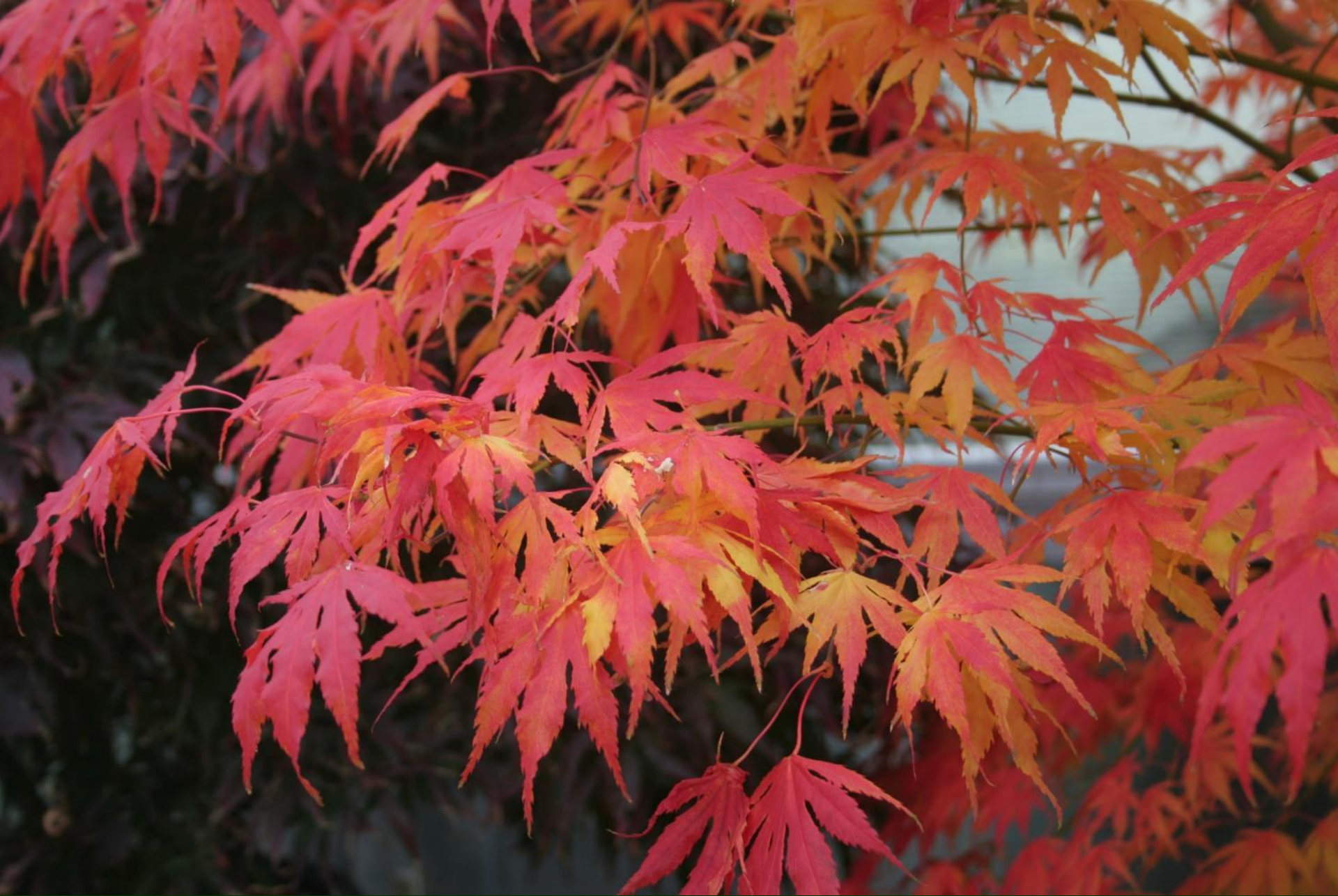
Acer palm. 'Julia D.'