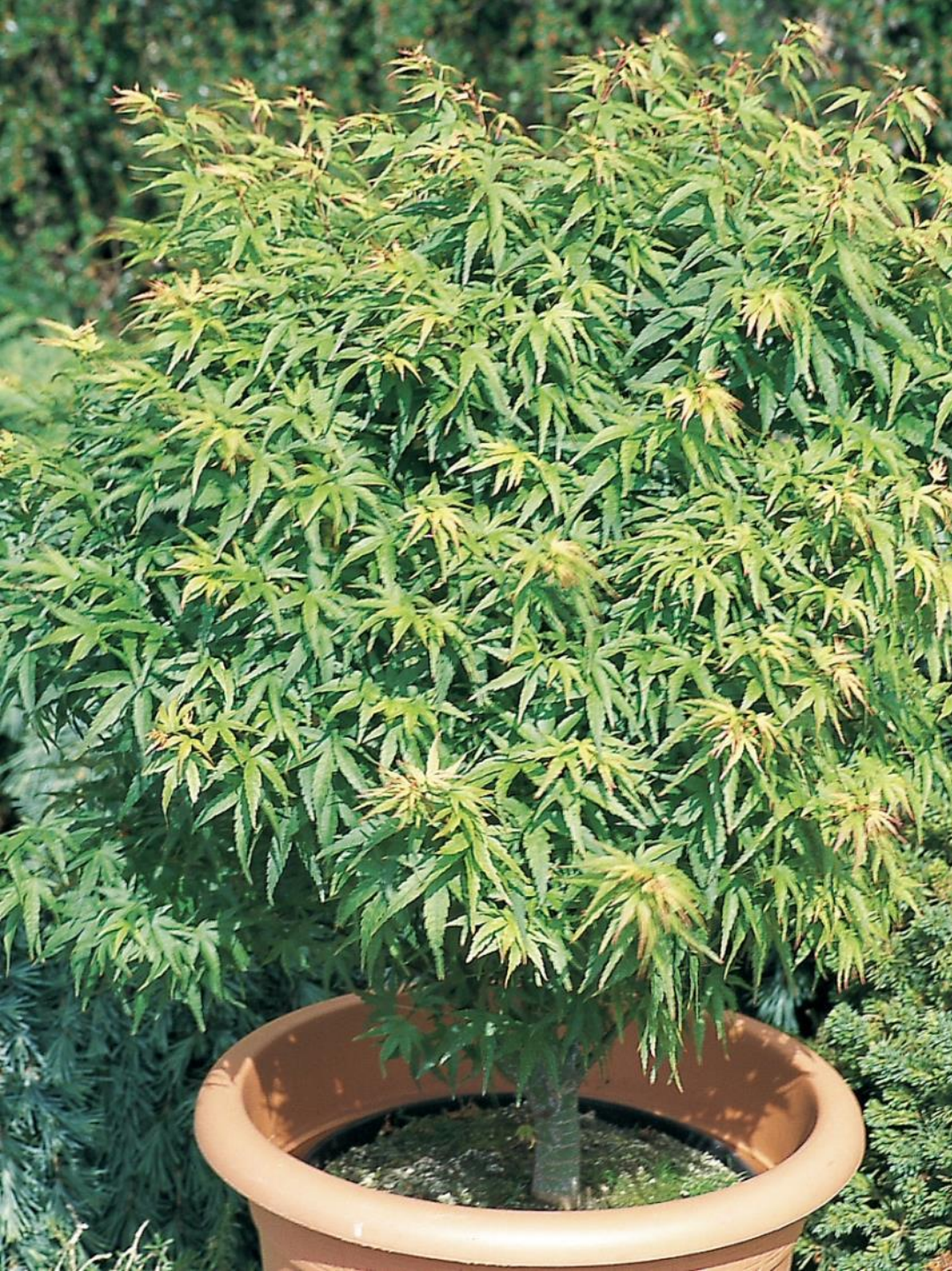
Acer palm. 'Sharps Pygmy'