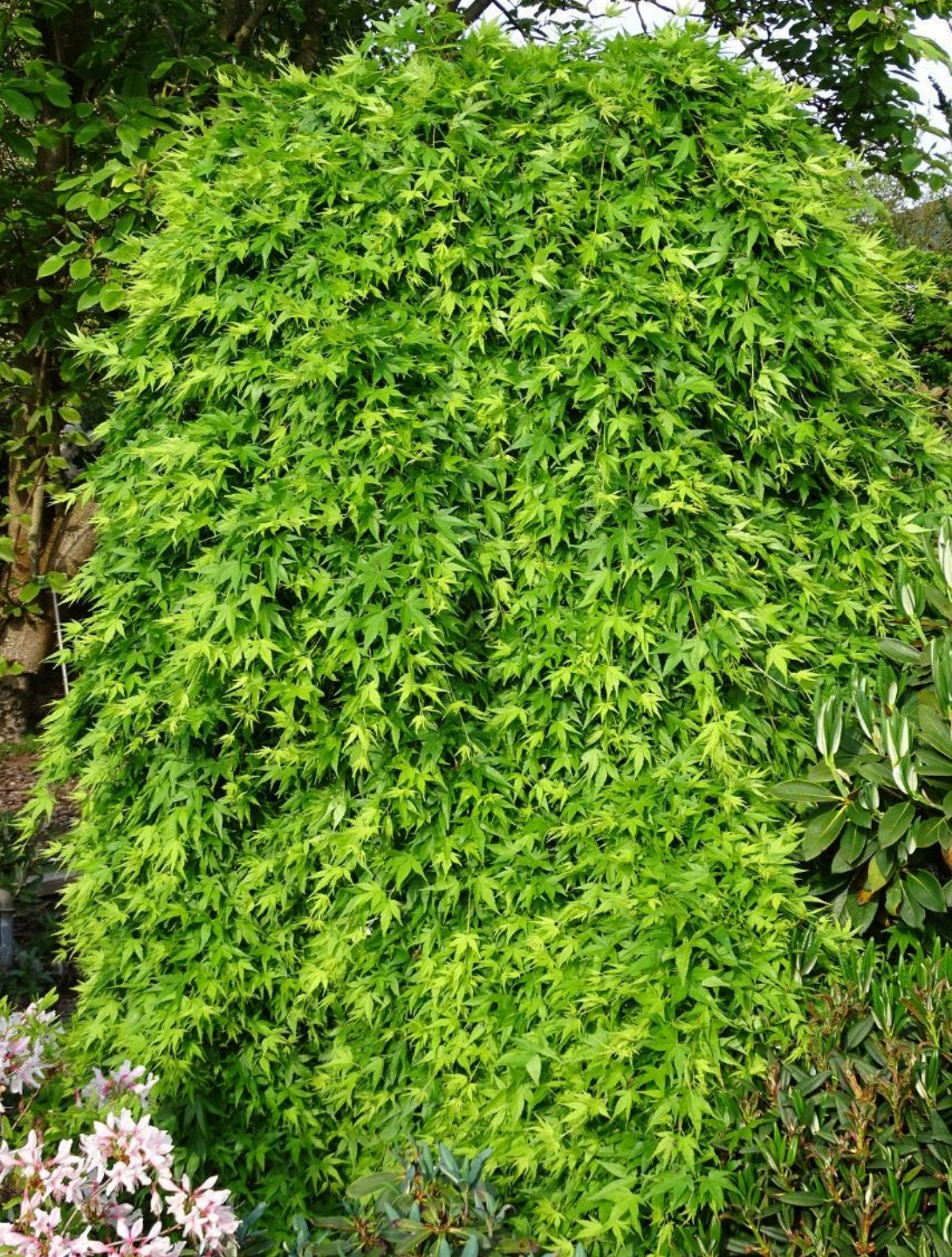
Acer palm. 'Ryu sei'