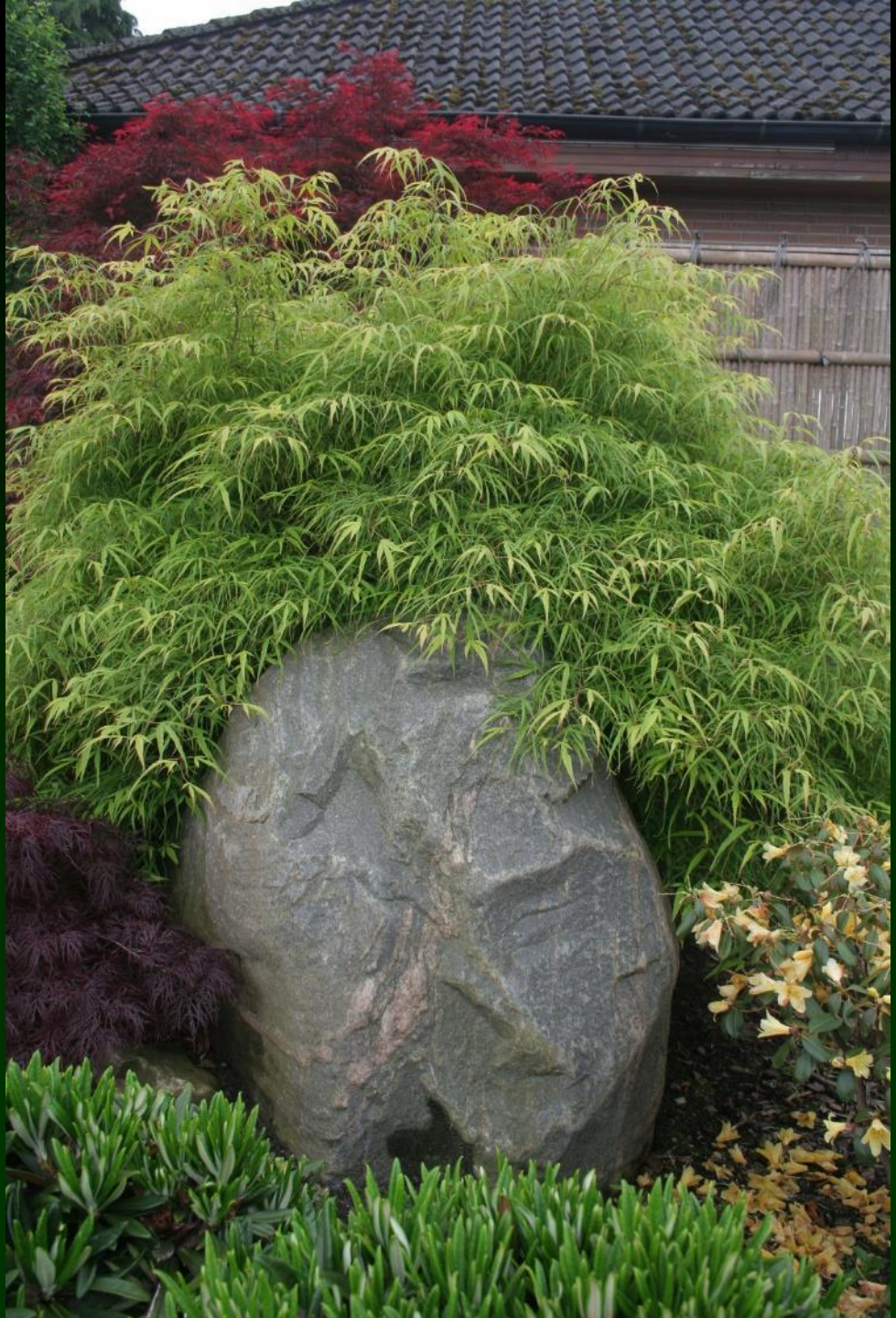
Acer palm. 'Kinshii'