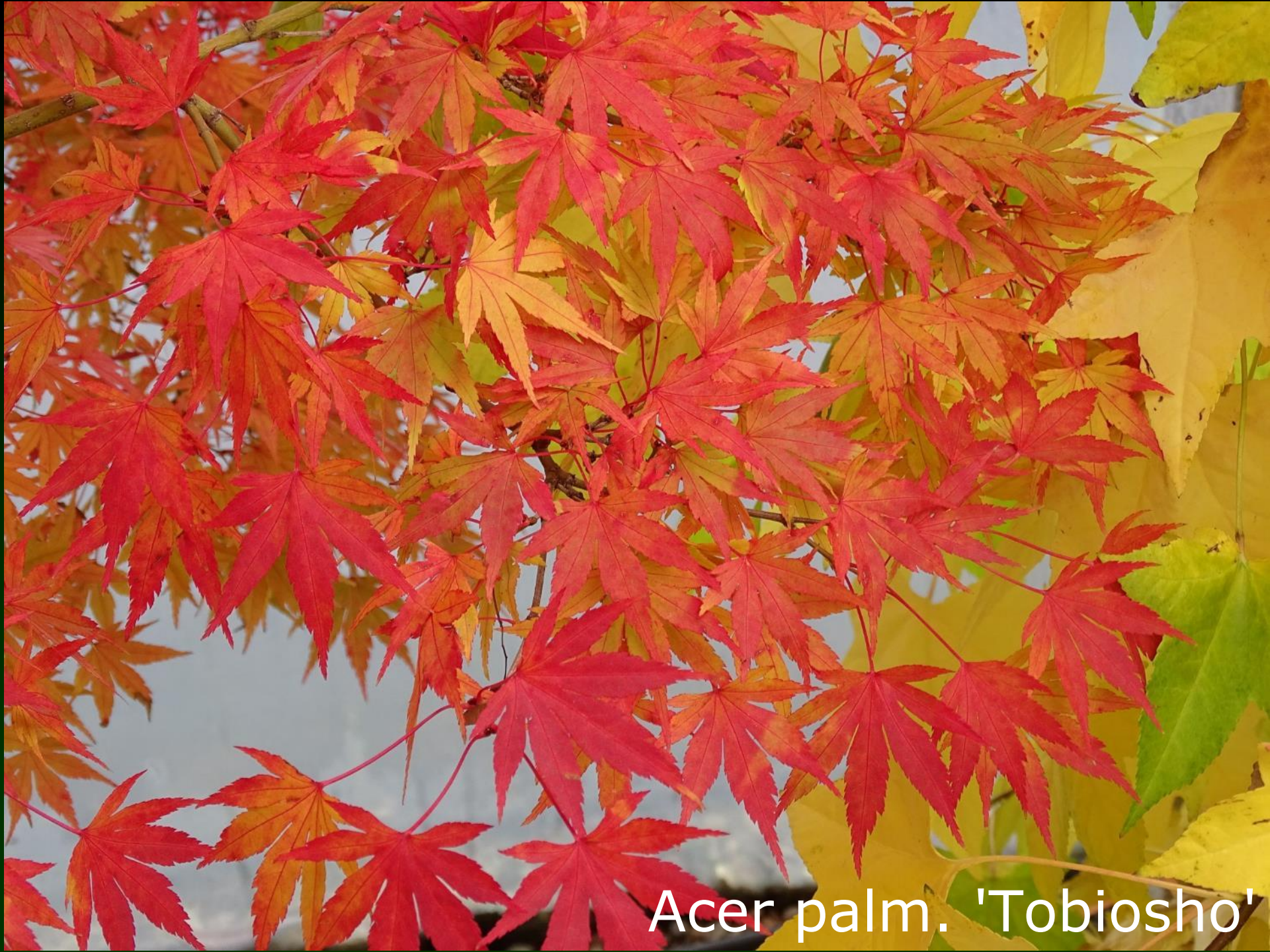
Acer palm. 'Tobiosho'