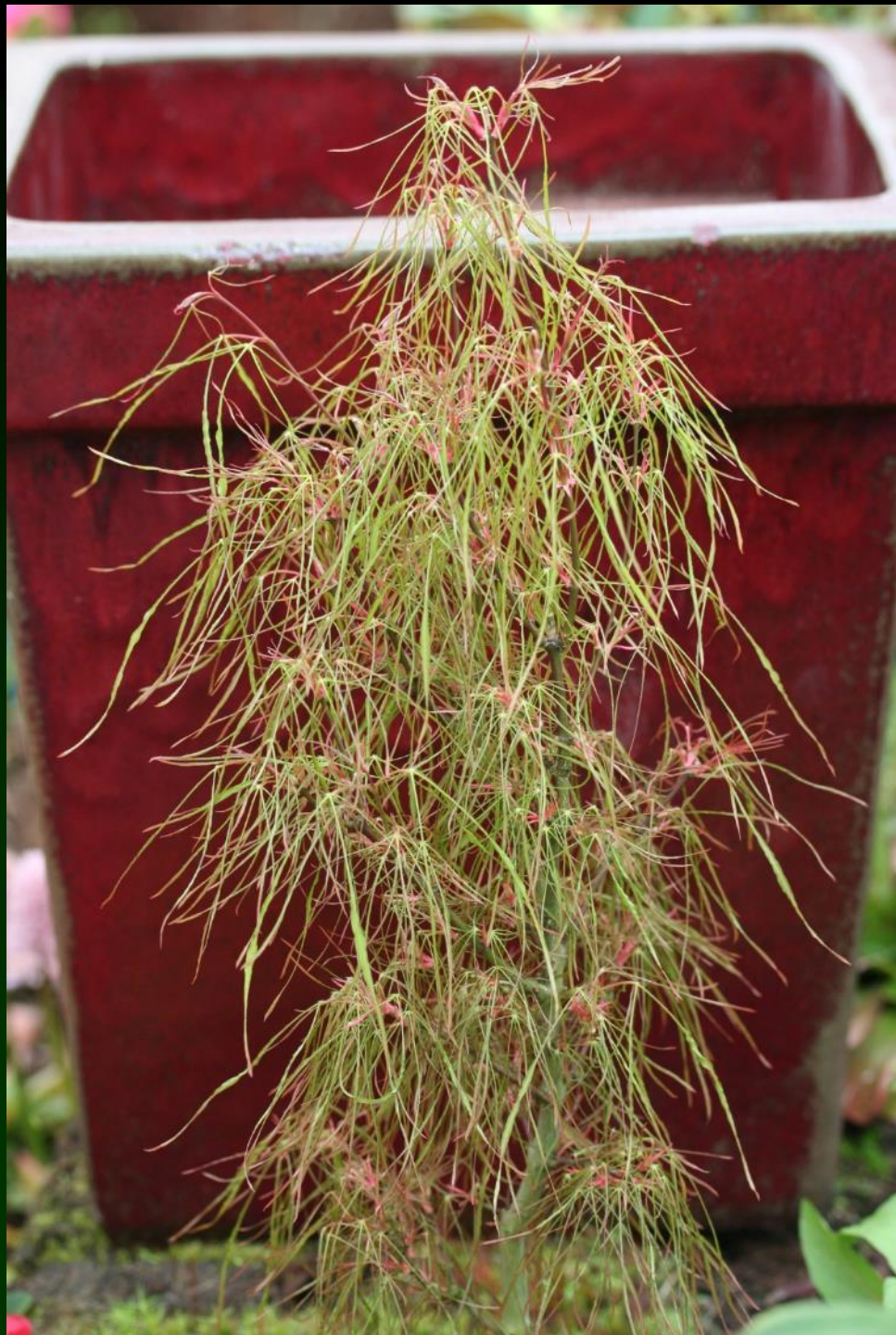
Acer palm. 'Fairy Hair'