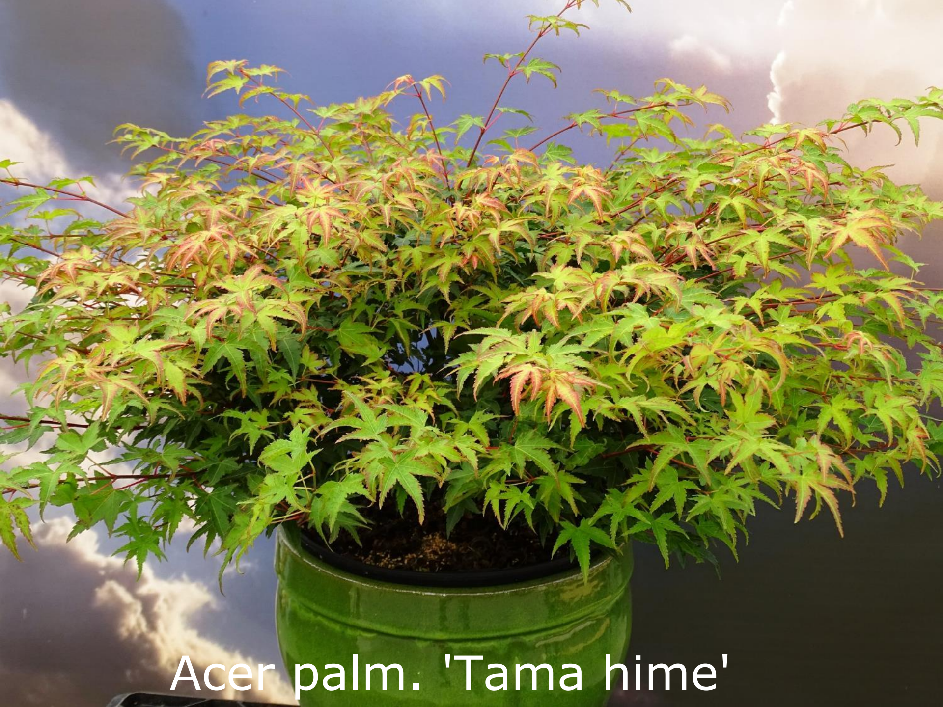
Acer palm. 'Tama hime'