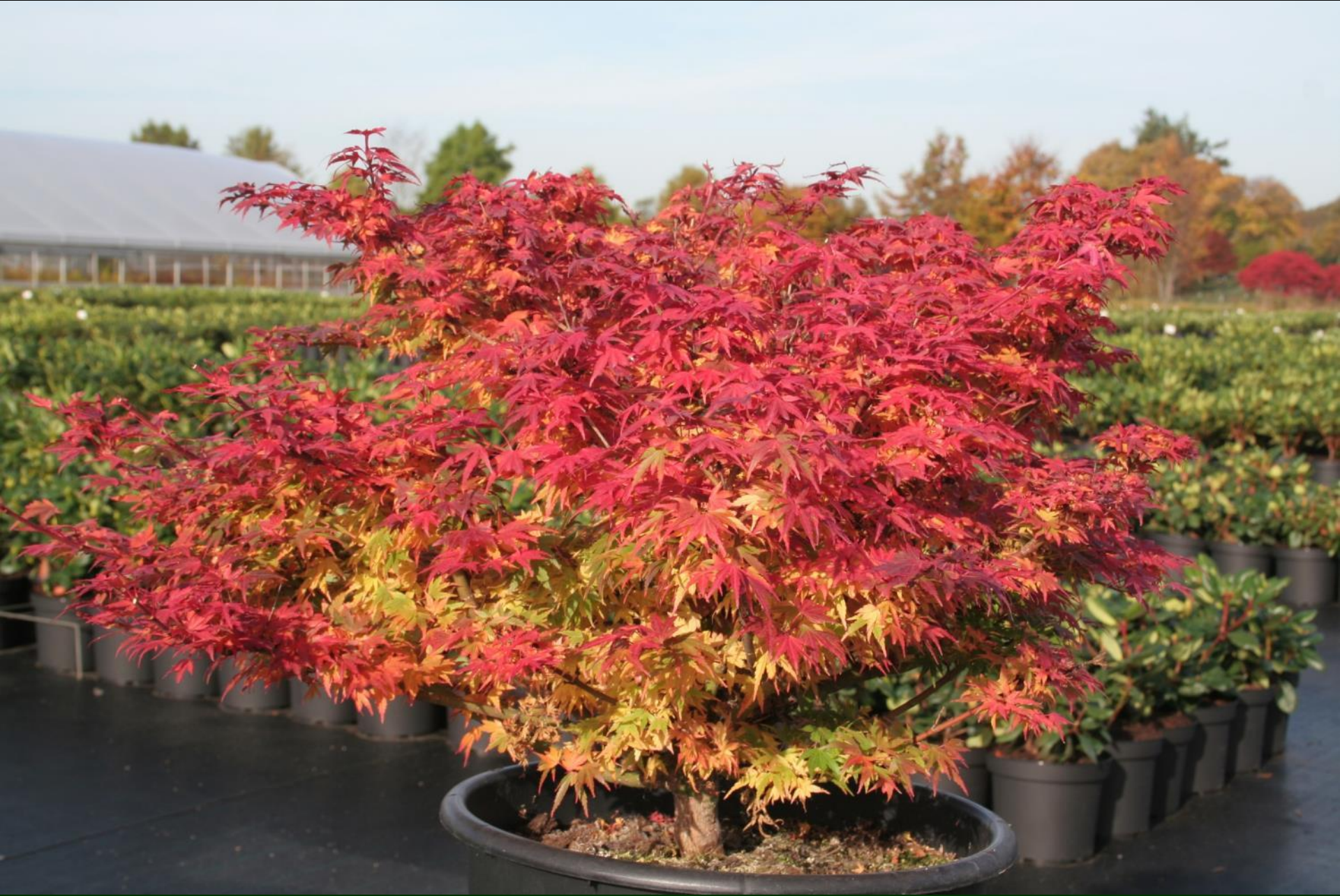
Acer palm. 'Coonara Pygmy'