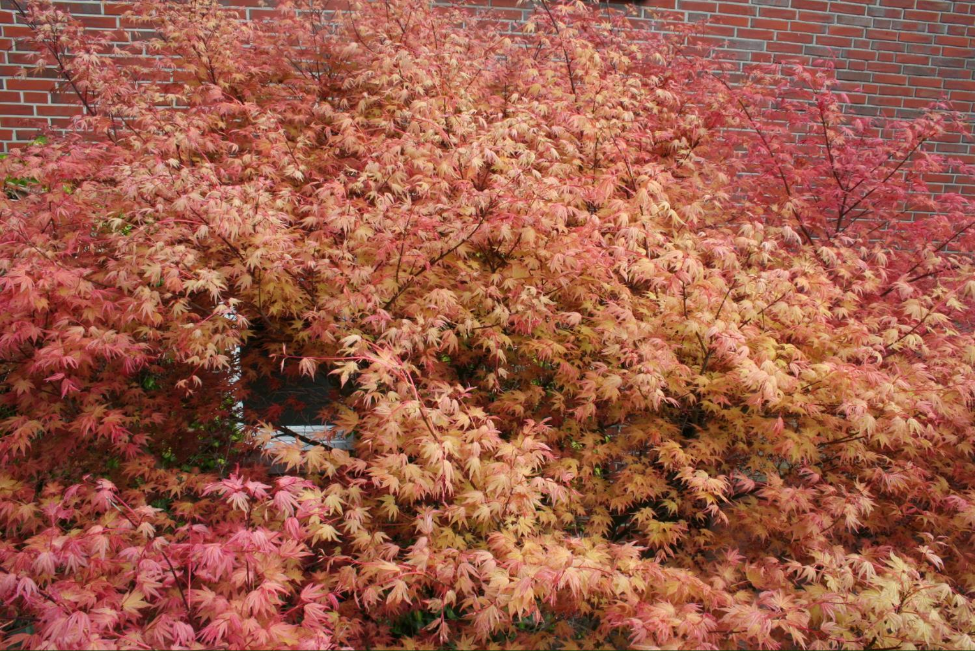
Acer palmatum 'Deshojo'