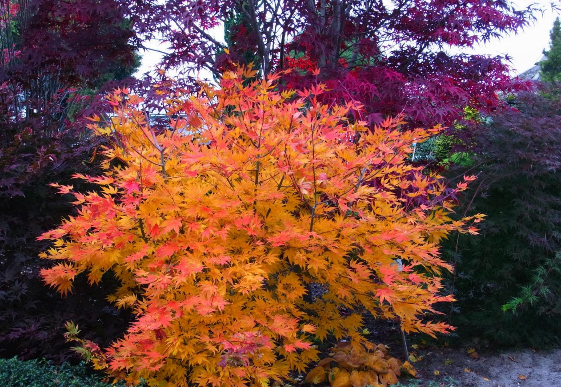
Acer palmatum 'Beni musume'