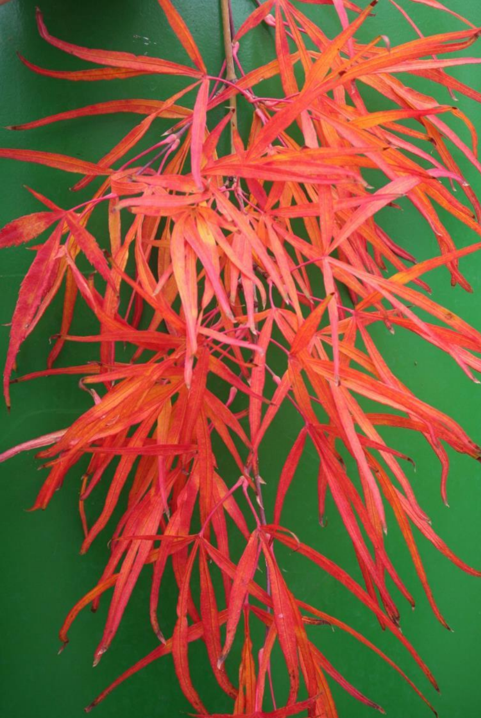
Acer palm. 'Red Pygmy'