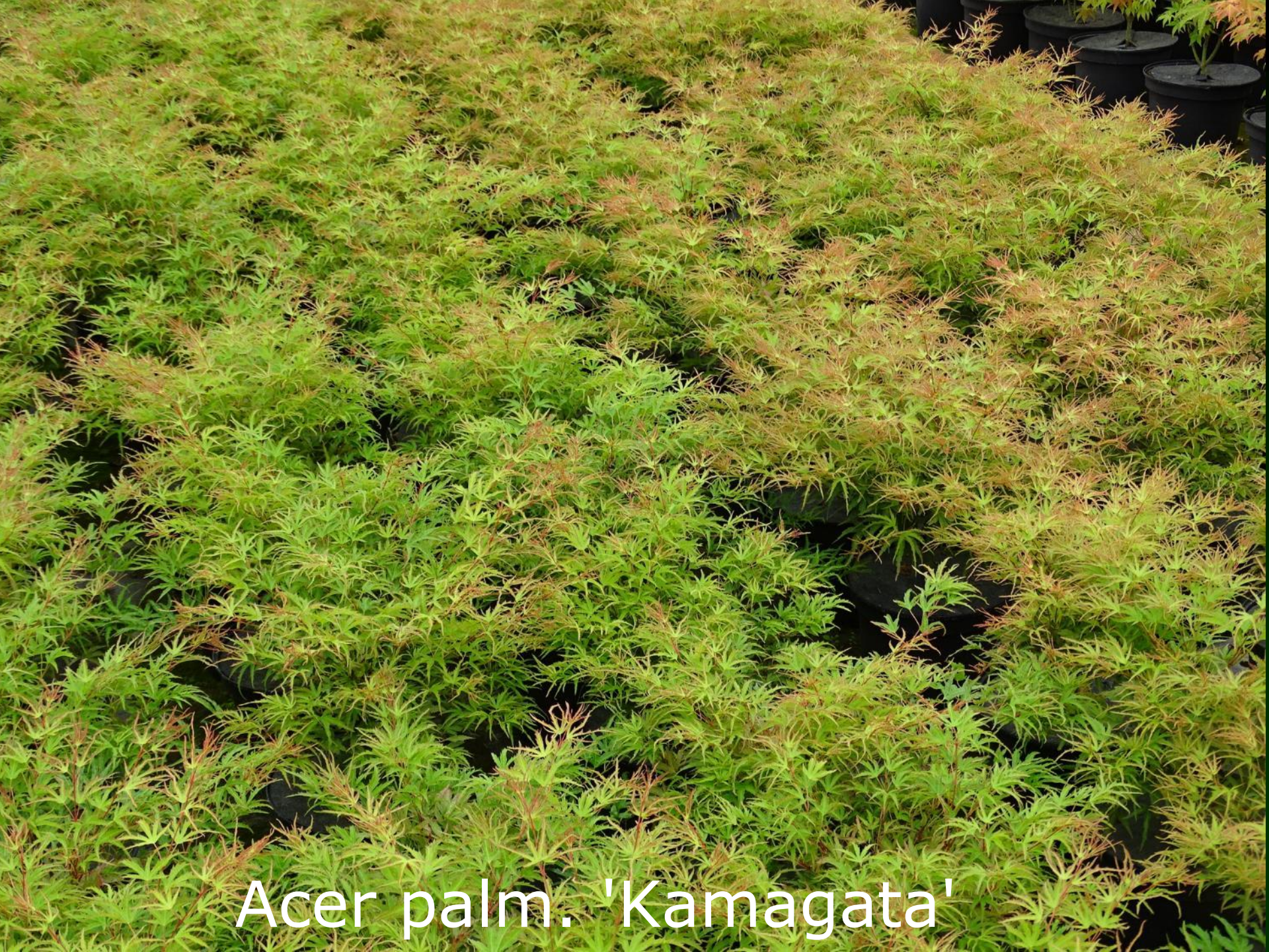
Acer palm. 'Kamagata'