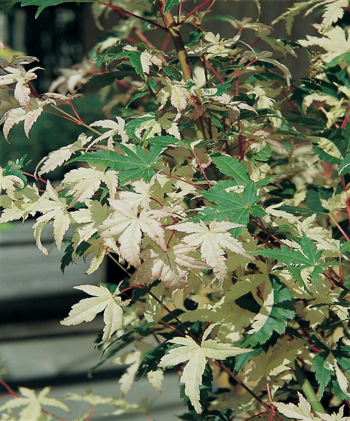
Acer palm. 'Oridono nishiki'