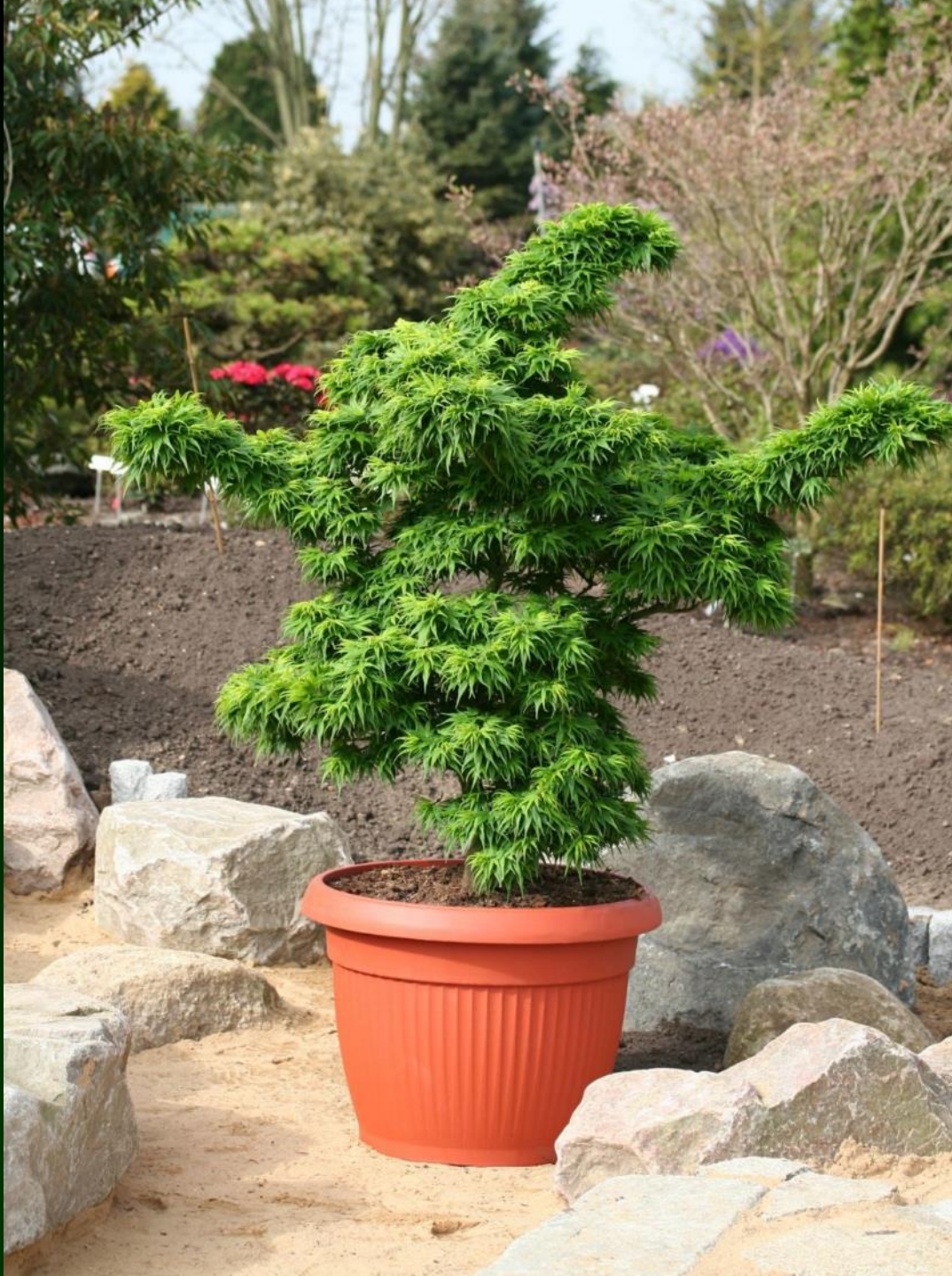
Acer palm. 'Mikawa yatsubusa'