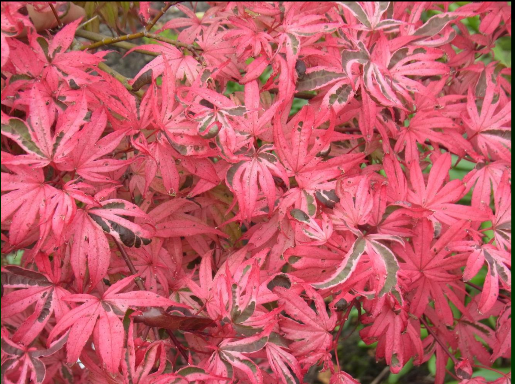
Acer palm. 'Shirazz' ®