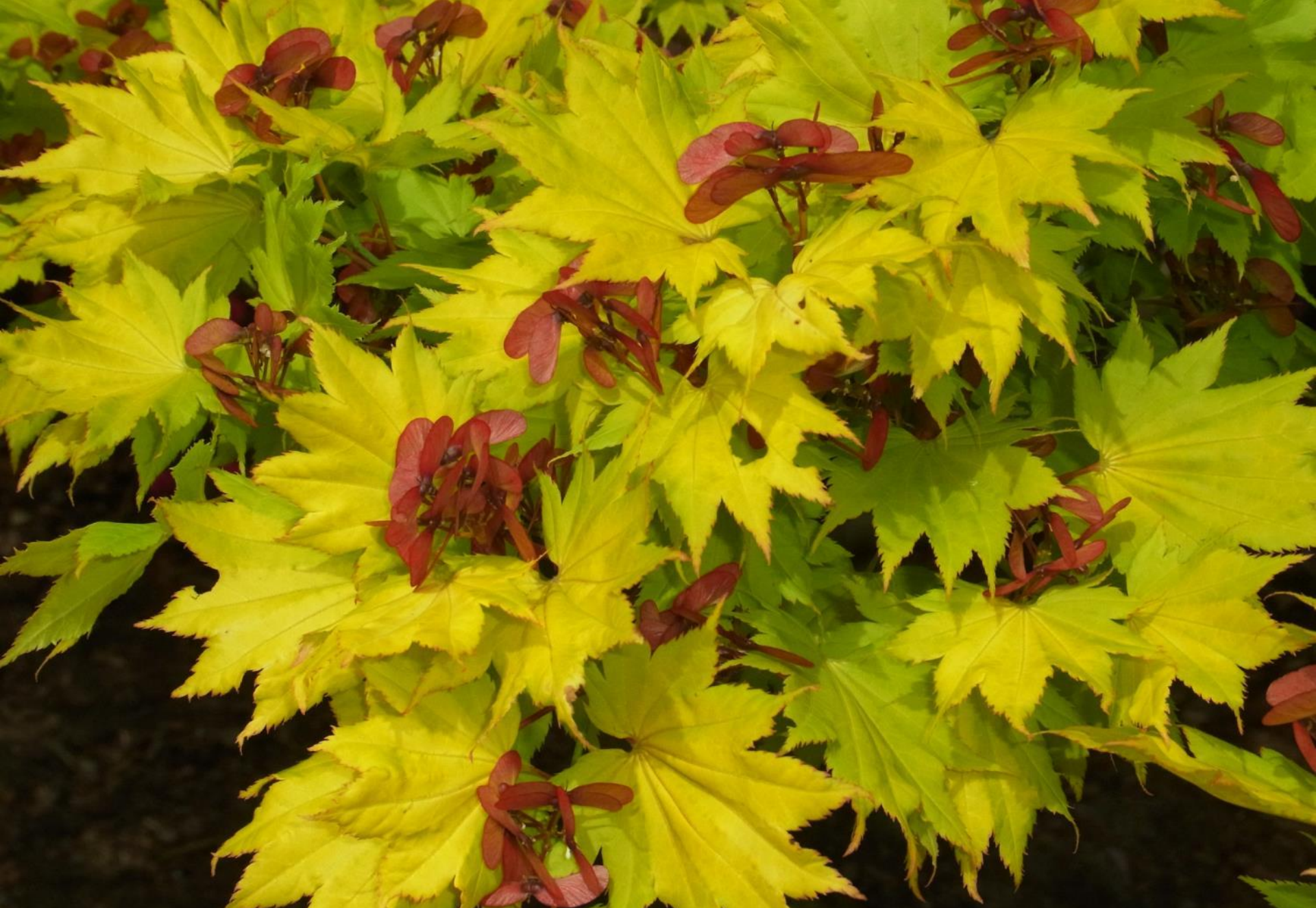
Acer shirasawanum 'Aureum'