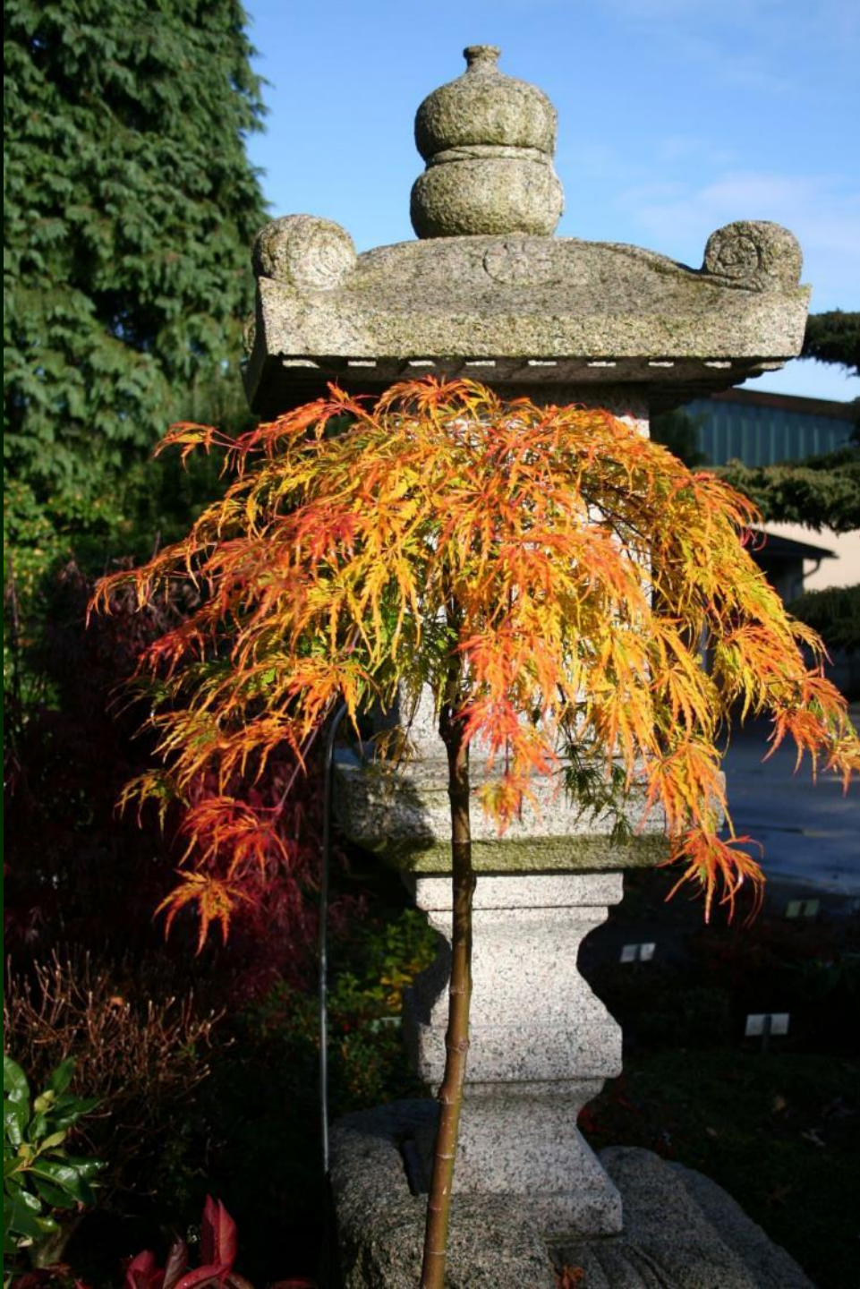
Acer palm. 'Palmatifidum'