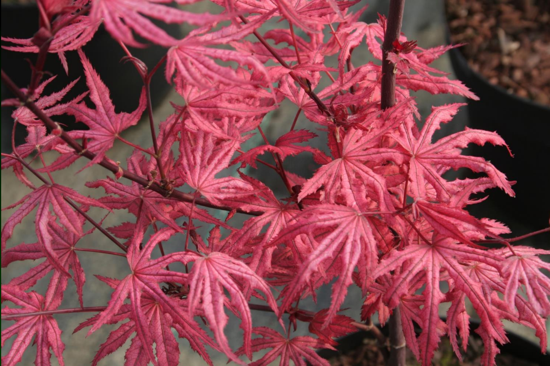
Acer palm. 'Amagi shigure'