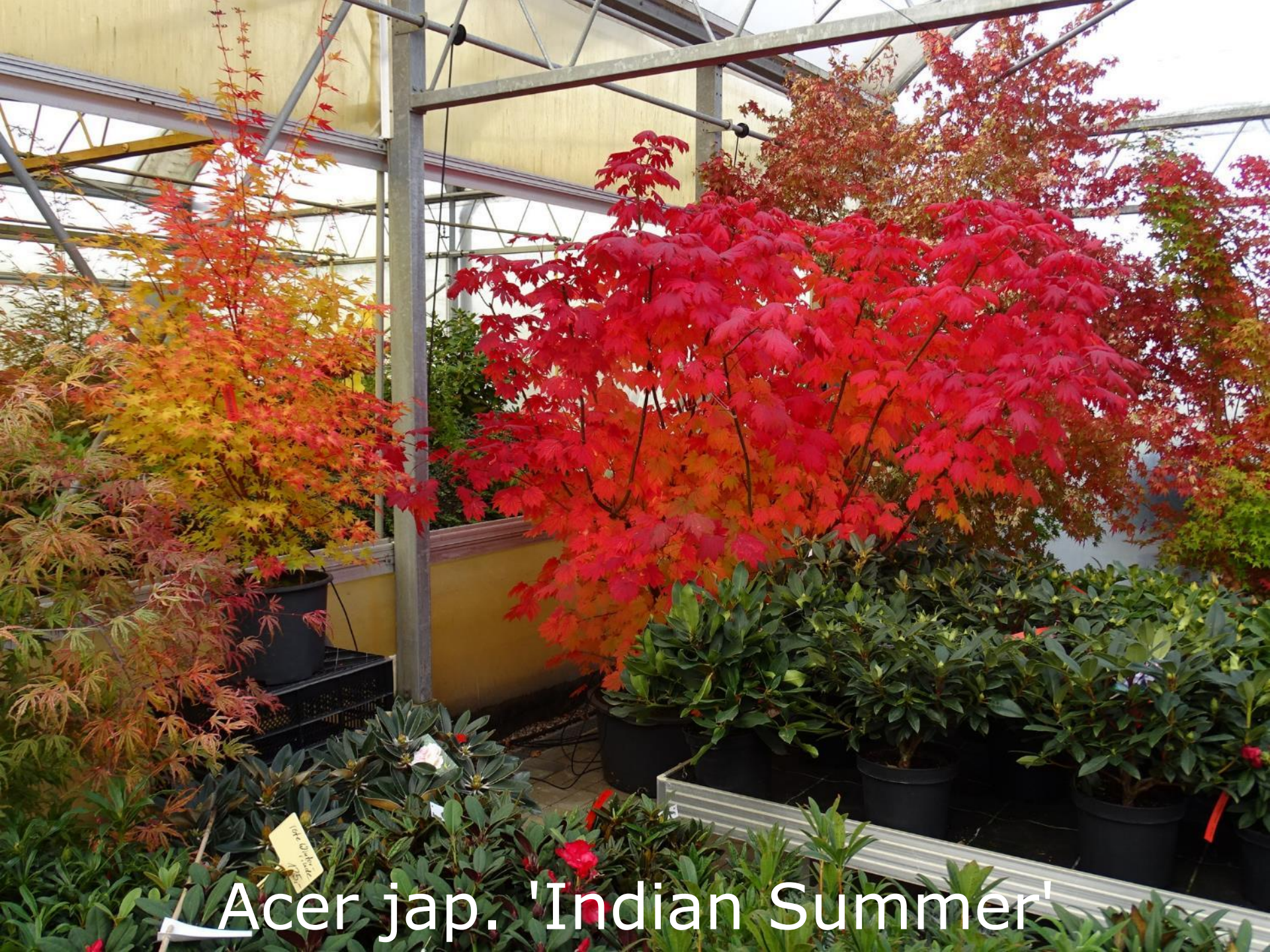
← Acer jap. 'Indian Summer'