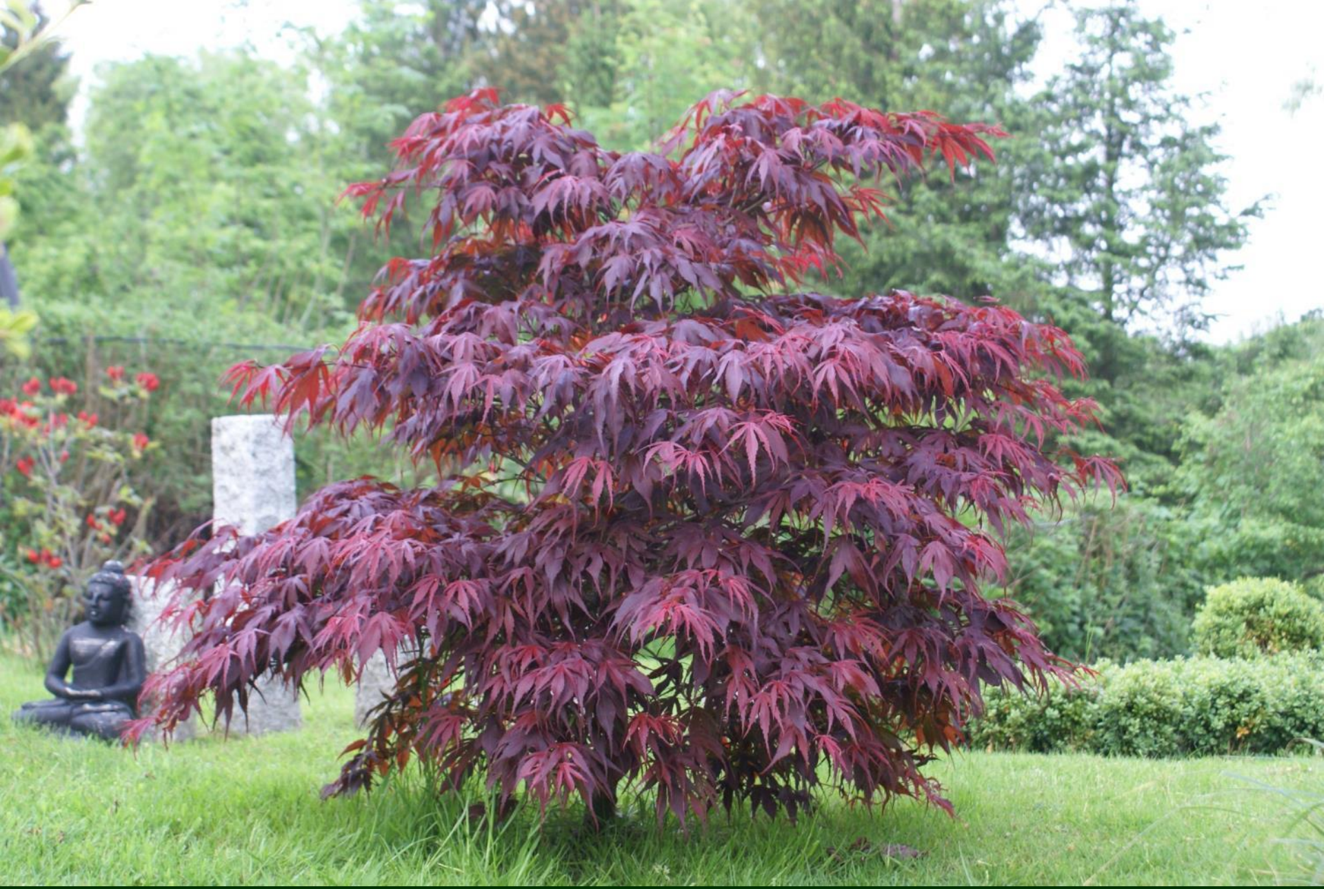
Acer palm. 'Oregon Sunset'