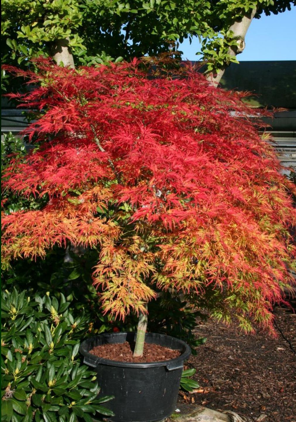
Acer palm. 'Green Globe'