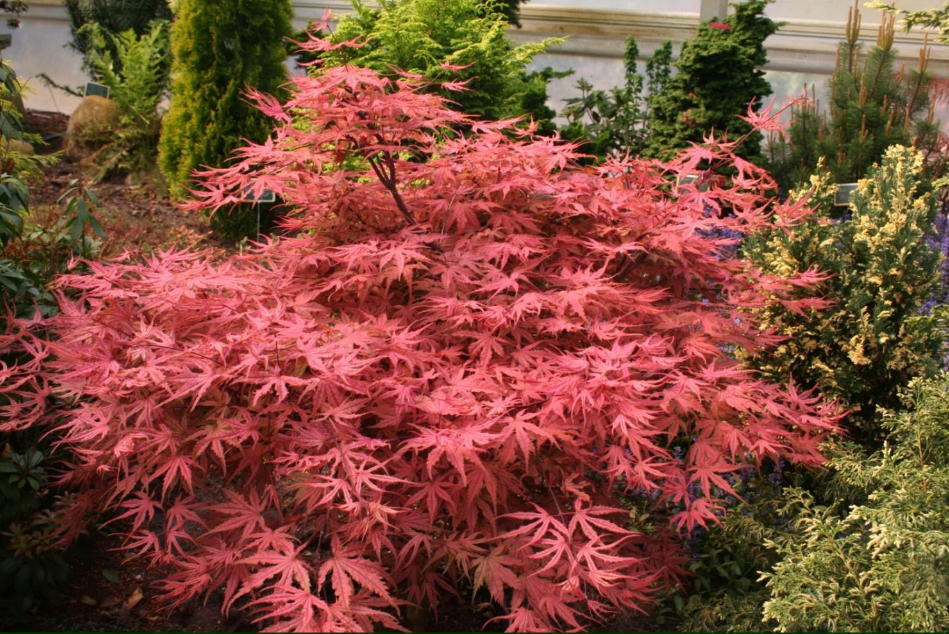
Acer palm. 'Olsen's Frosted Strawberry'