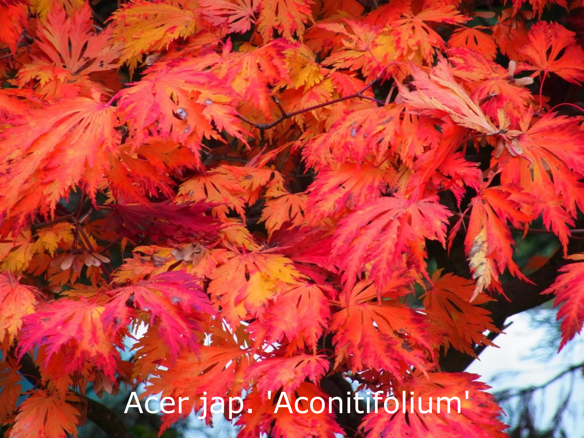
Acer jap. 'Aconitifolium'