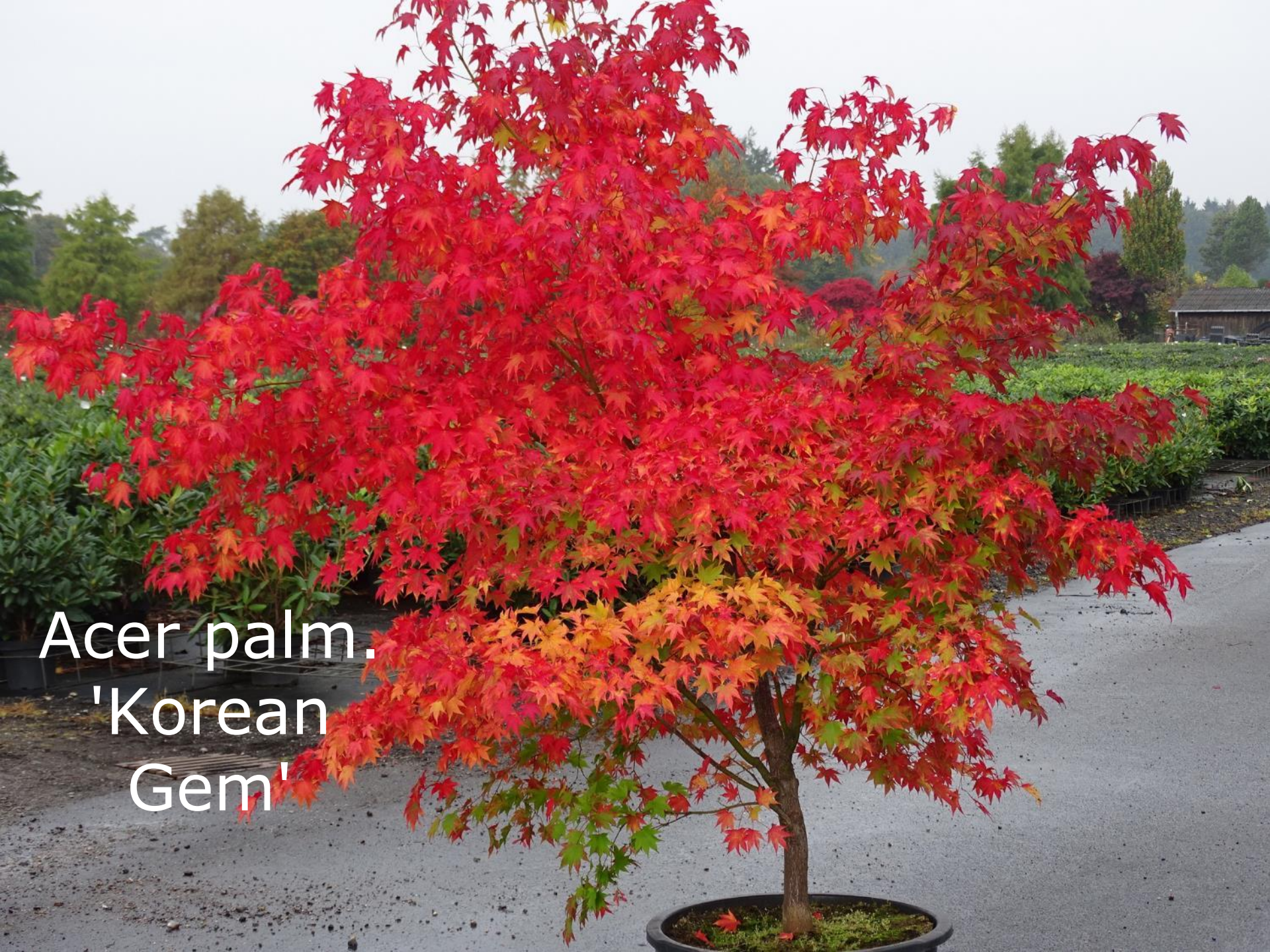
Acer palm. 'Korean Gem'