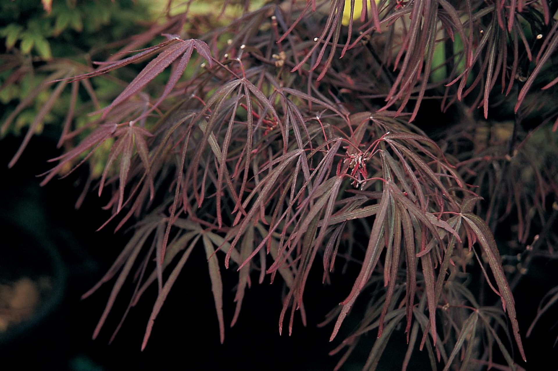
Acer palm. 'Pung Kil'