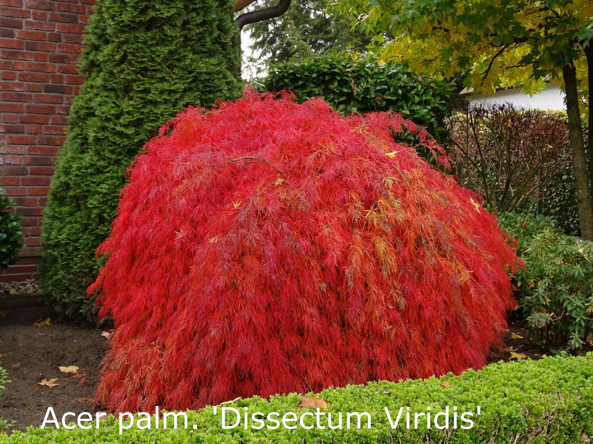
Acer palm. 'Dissectum Viridis'