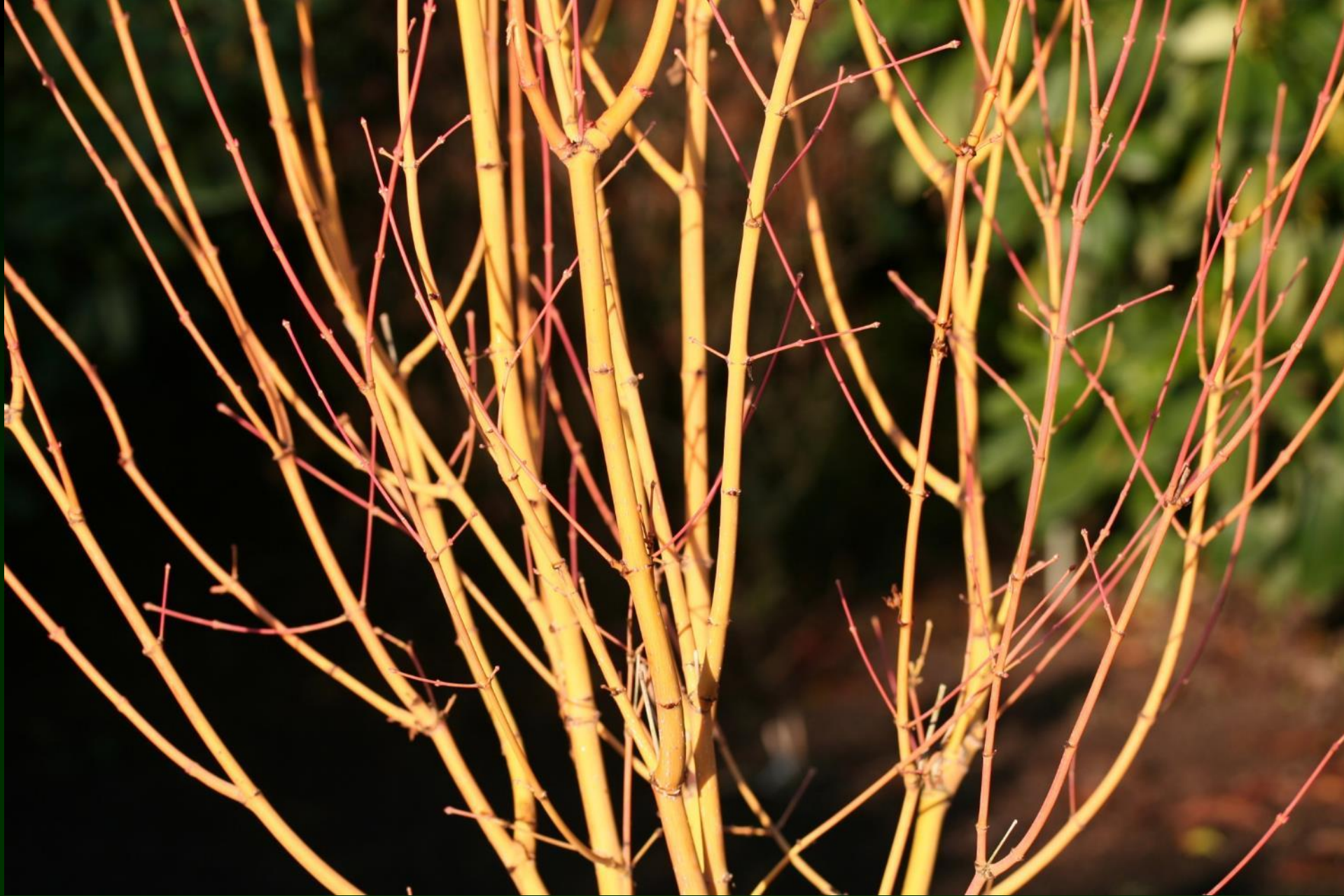
Acer palmatum 'Bi hoo'