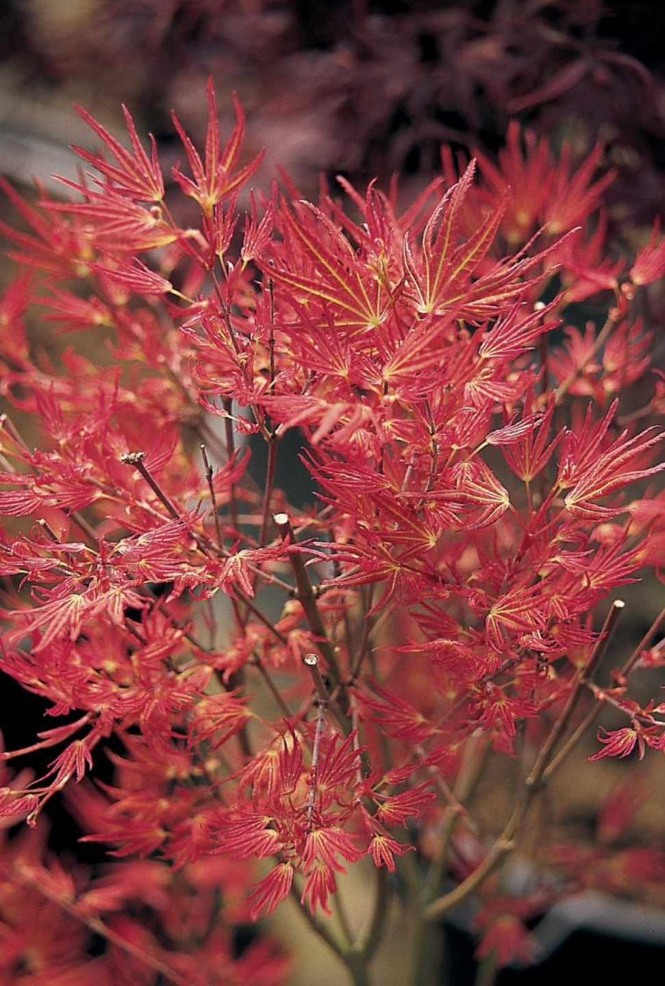
Acer palm. 'Wilson's Pink Dwarf'