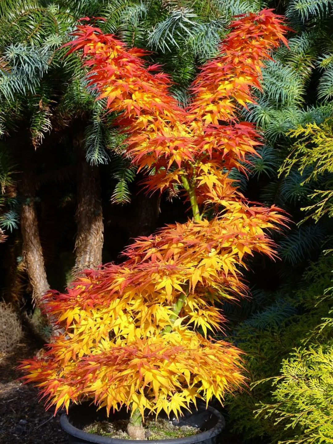
Acer palm. 'Mikawa yatsubusa'