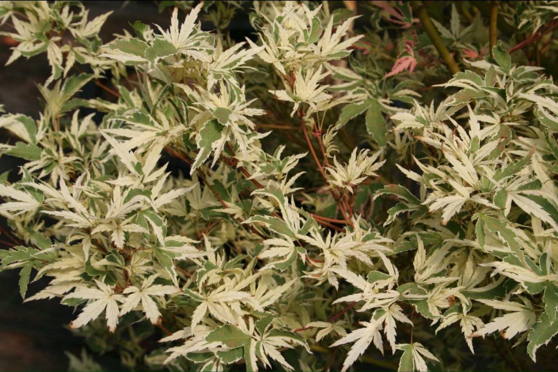
Acer palmatum 'Butterfly'