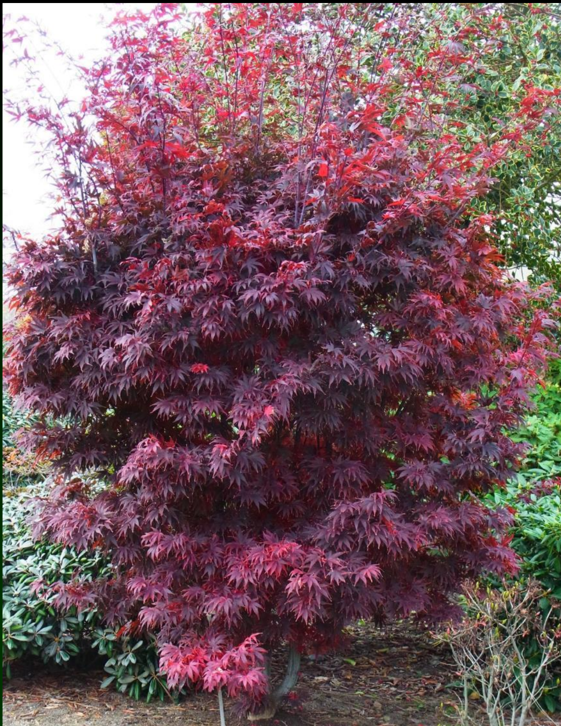
Acer palm. 'Pixie'