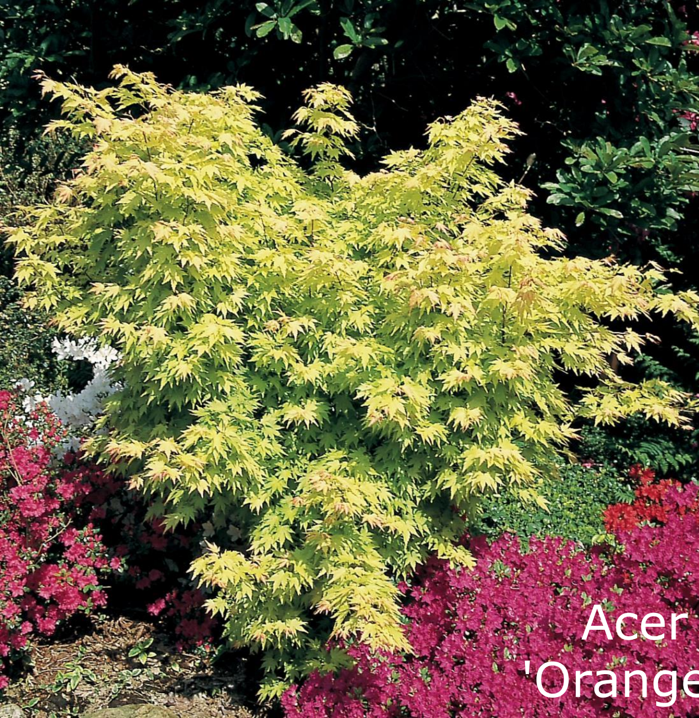
Acer palm. 'Orange Dream'