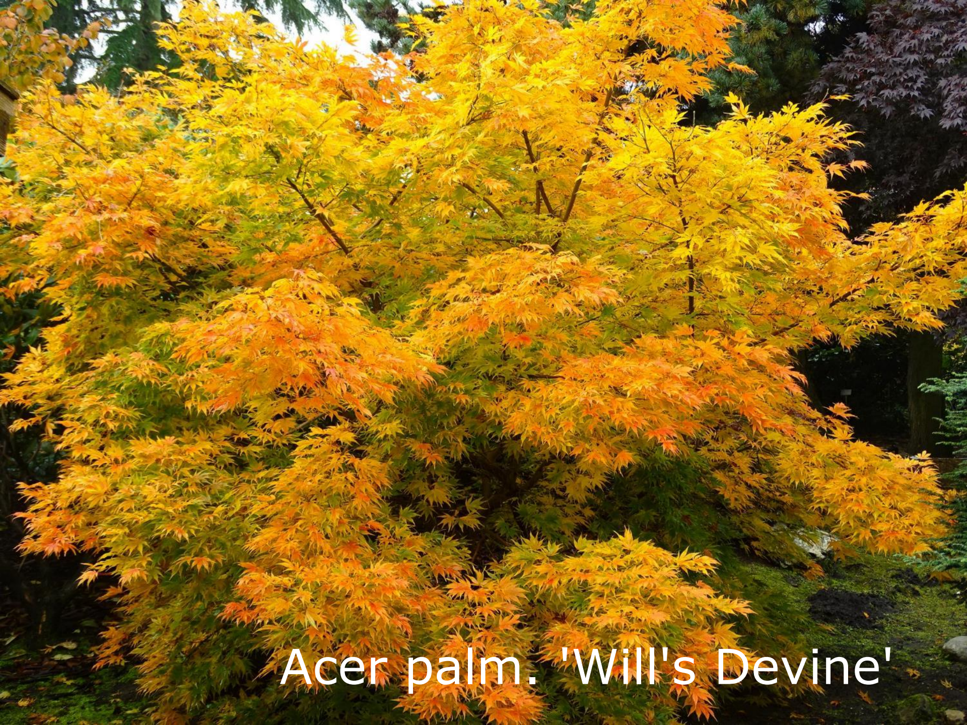
Acer palm. 'Will's Devine'