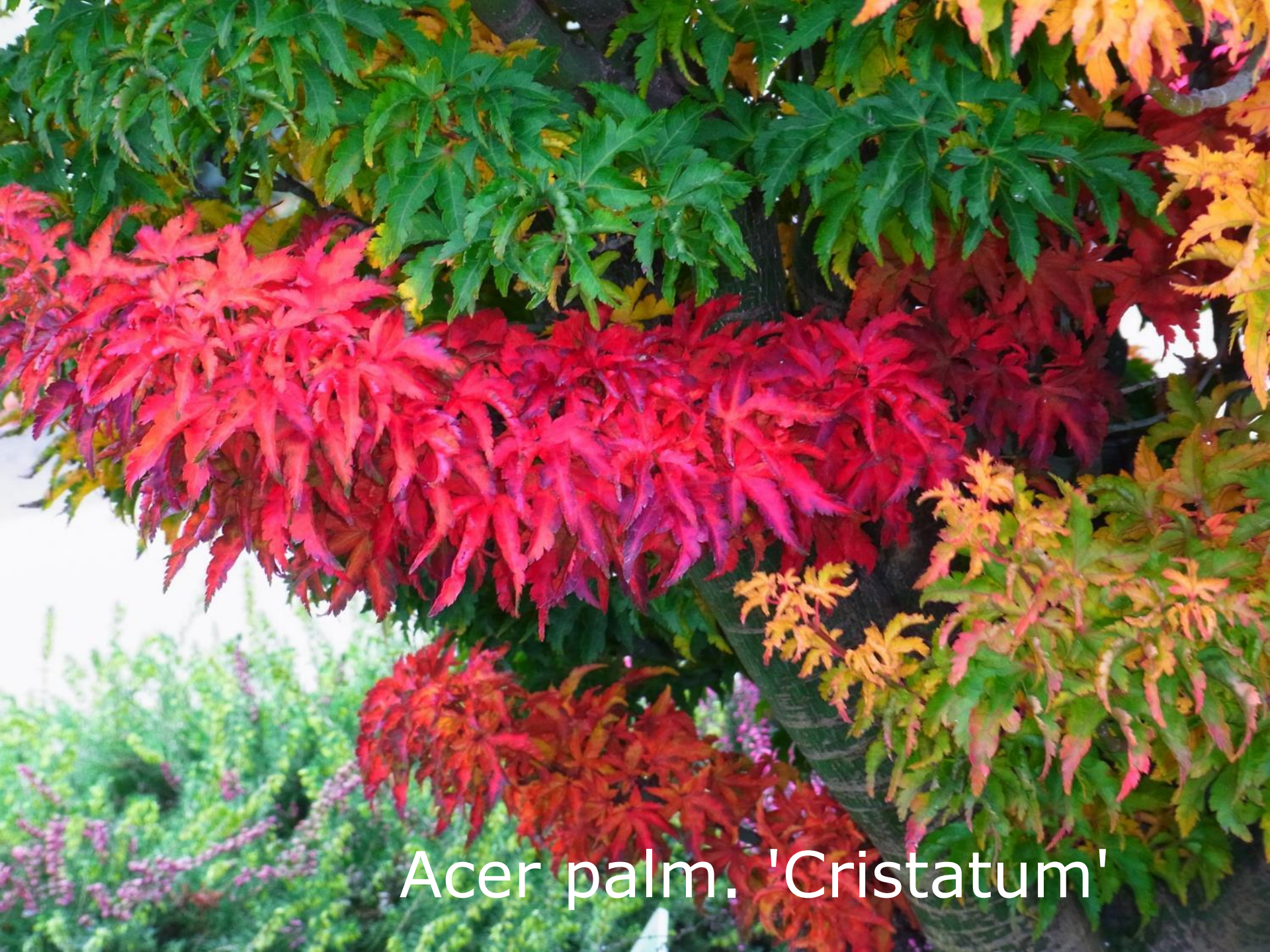
Acer palm. 'Cristatum'