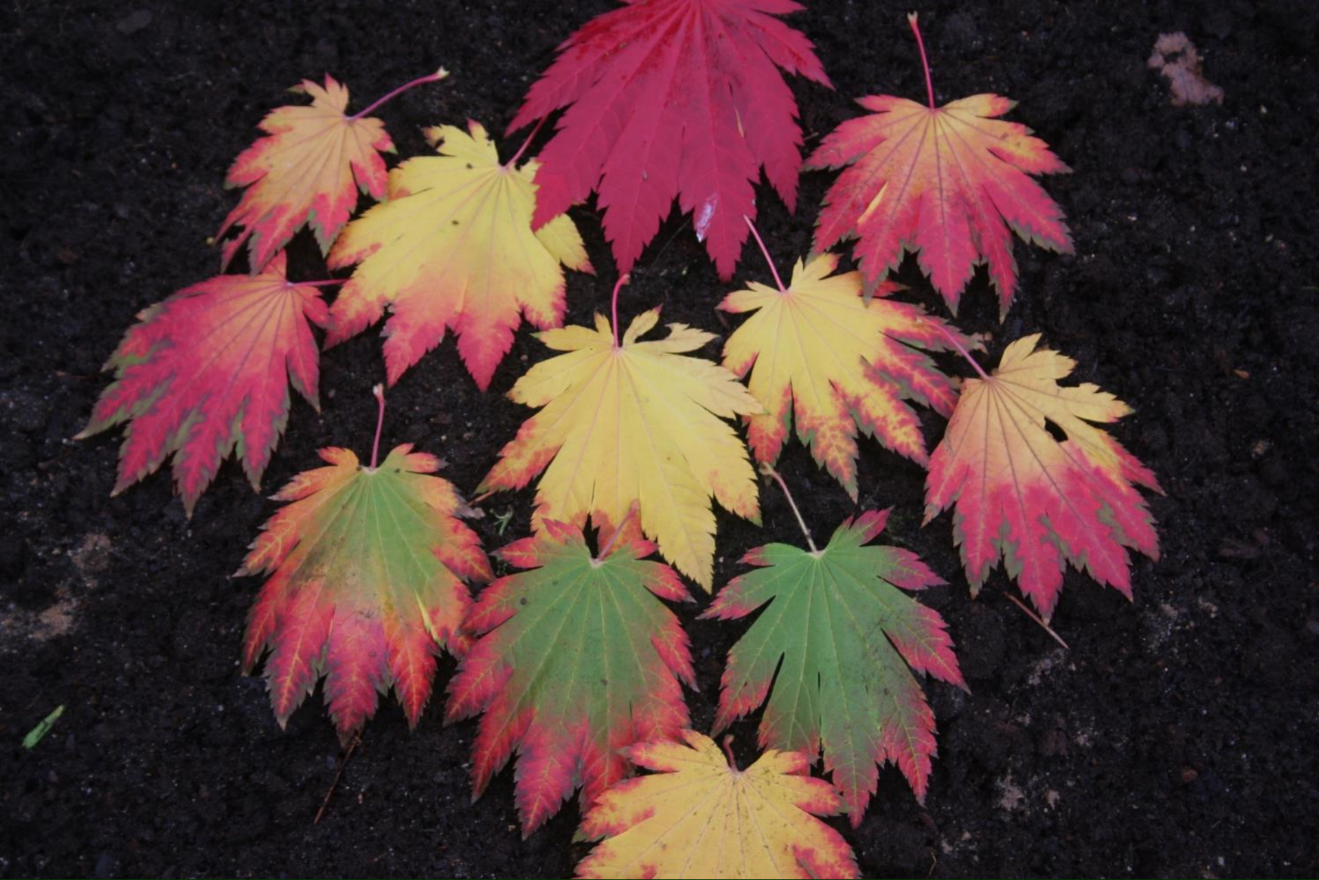
Acer jap. 'Indian Summer'