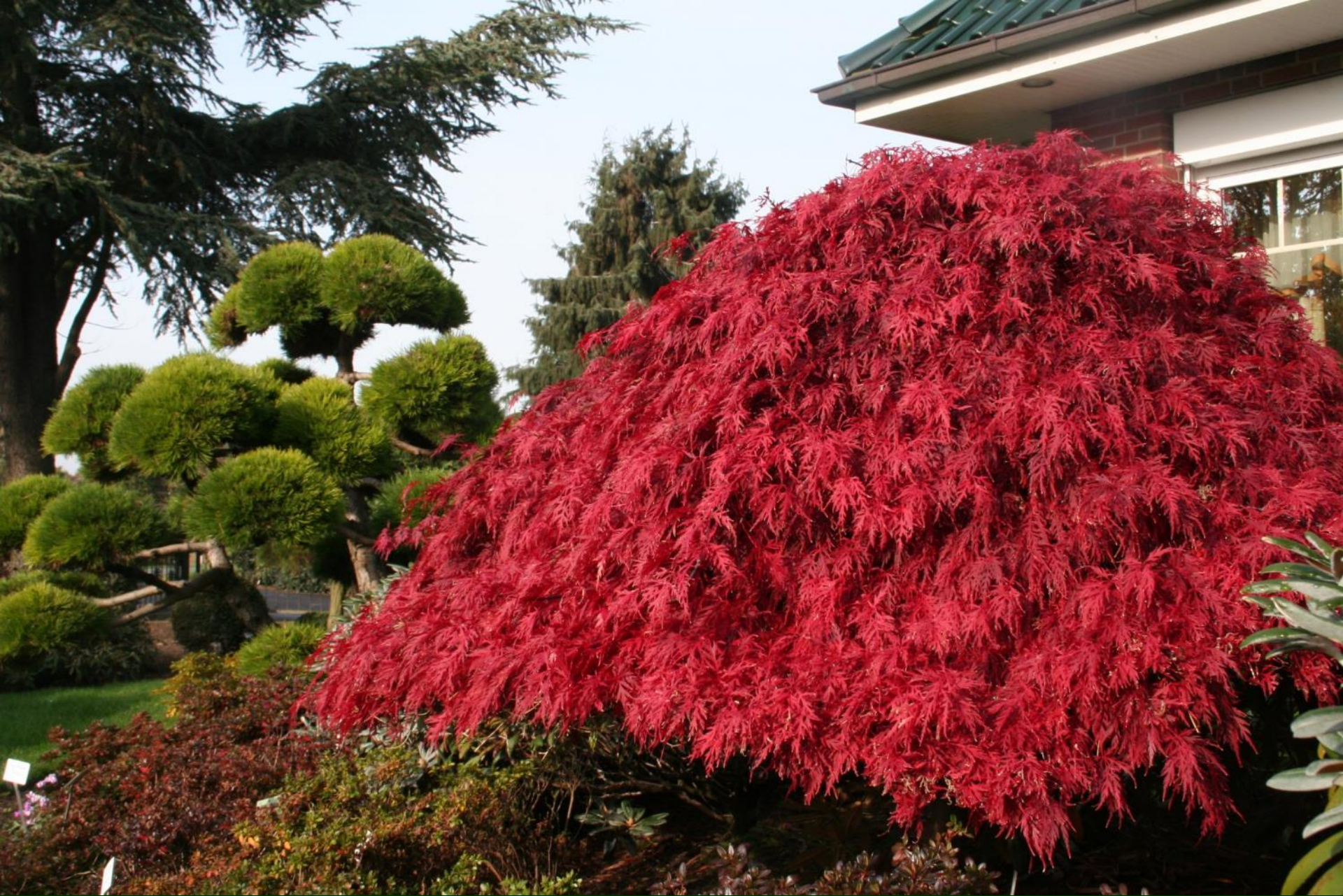
Acer palm. 'Orangeola'