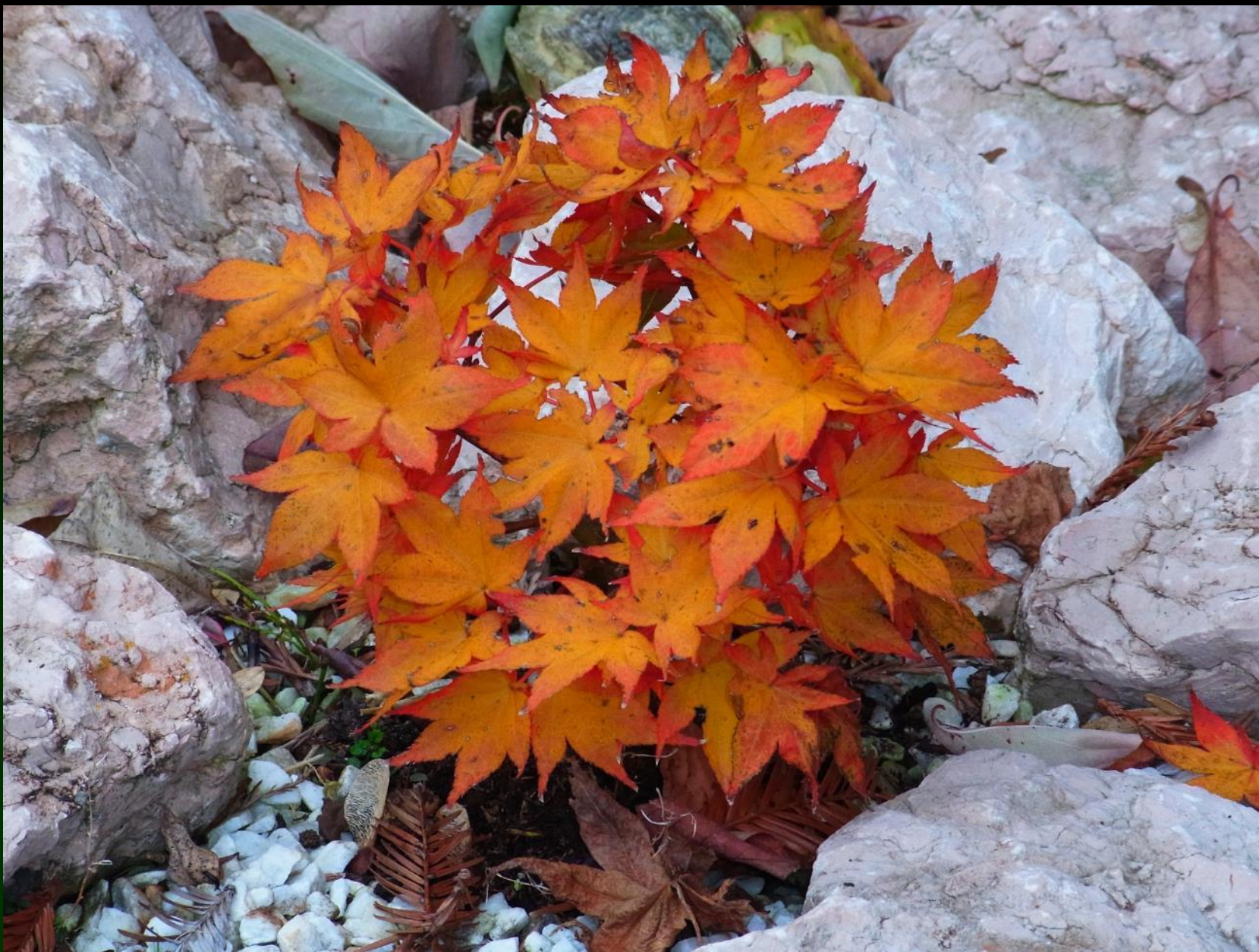
Acer palm. 'Ruby Stars'