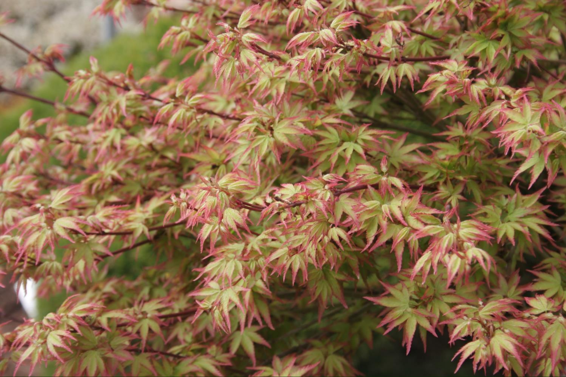
Acer palm. 'Murasaki kiyohime'