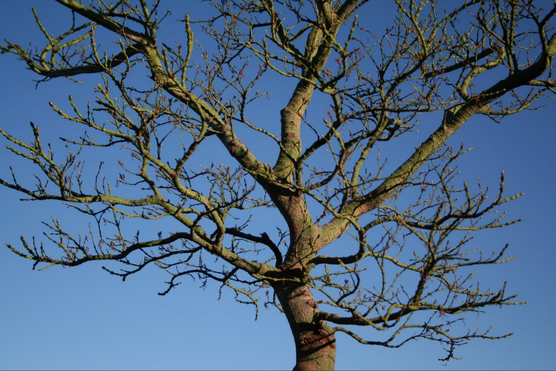
Acer palm. 'Mikawa yatsubusa'