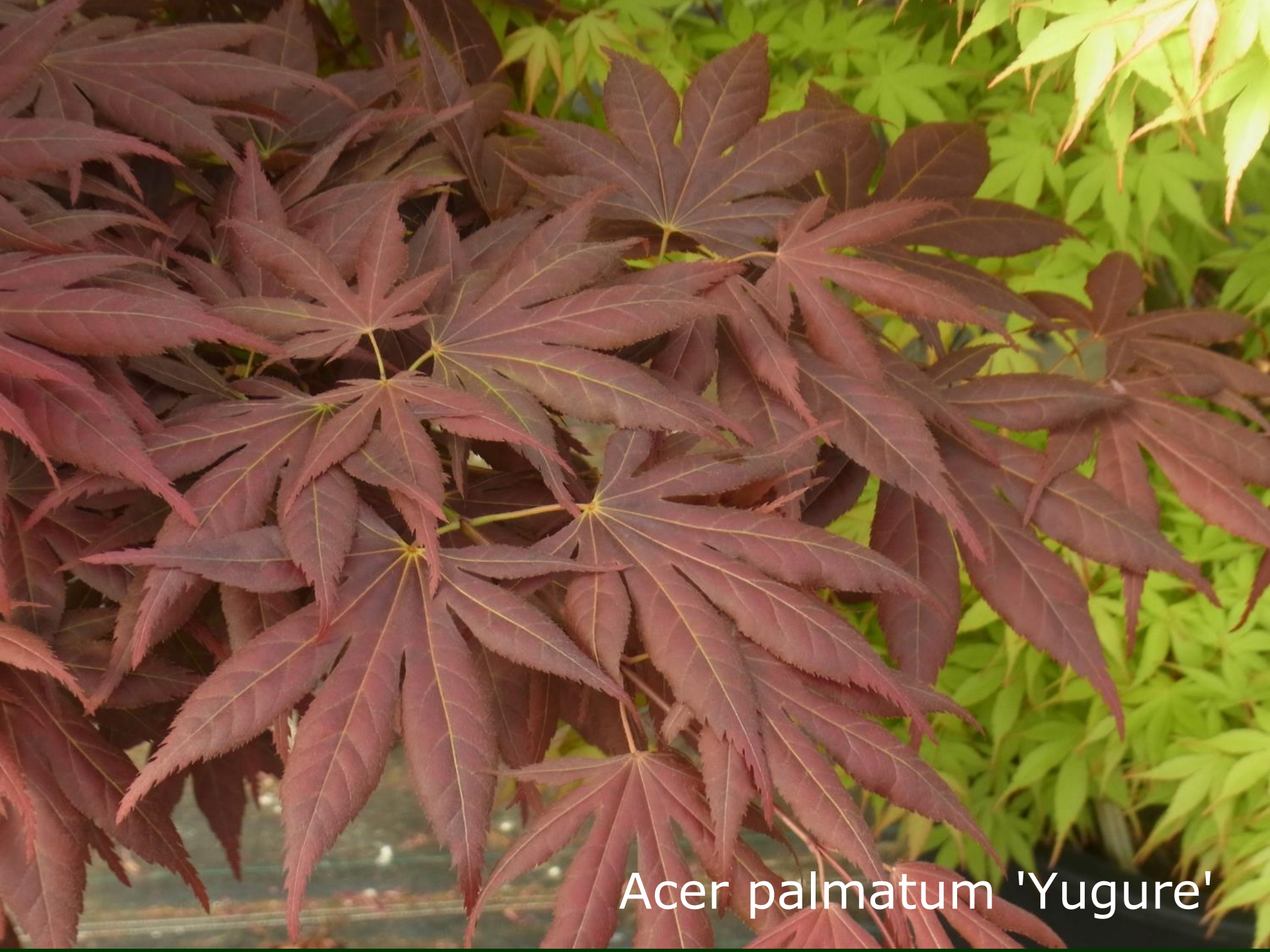
Acer palmatum 'Yugure'