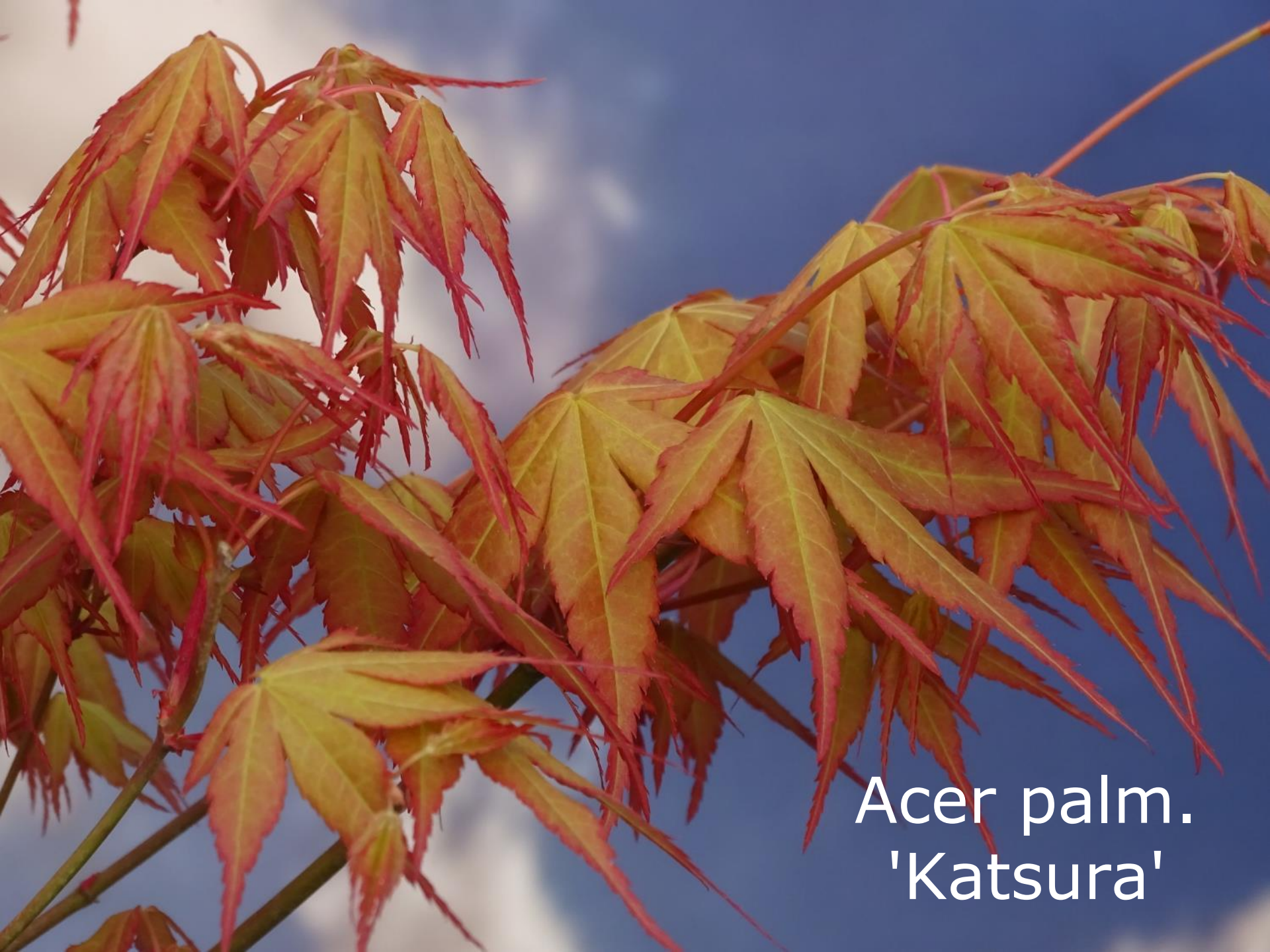
Acer palm. 'Katsura'