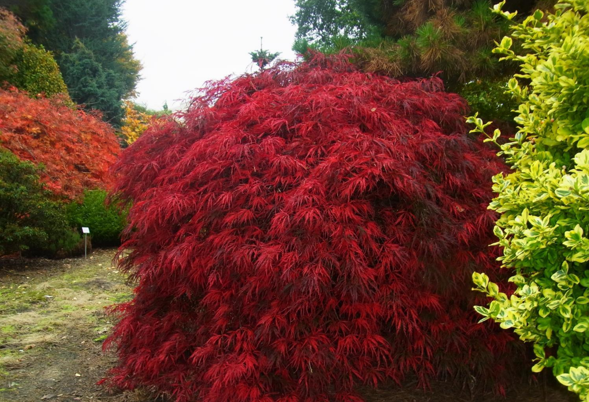
Acer palm. 'Dissectum Garnet'