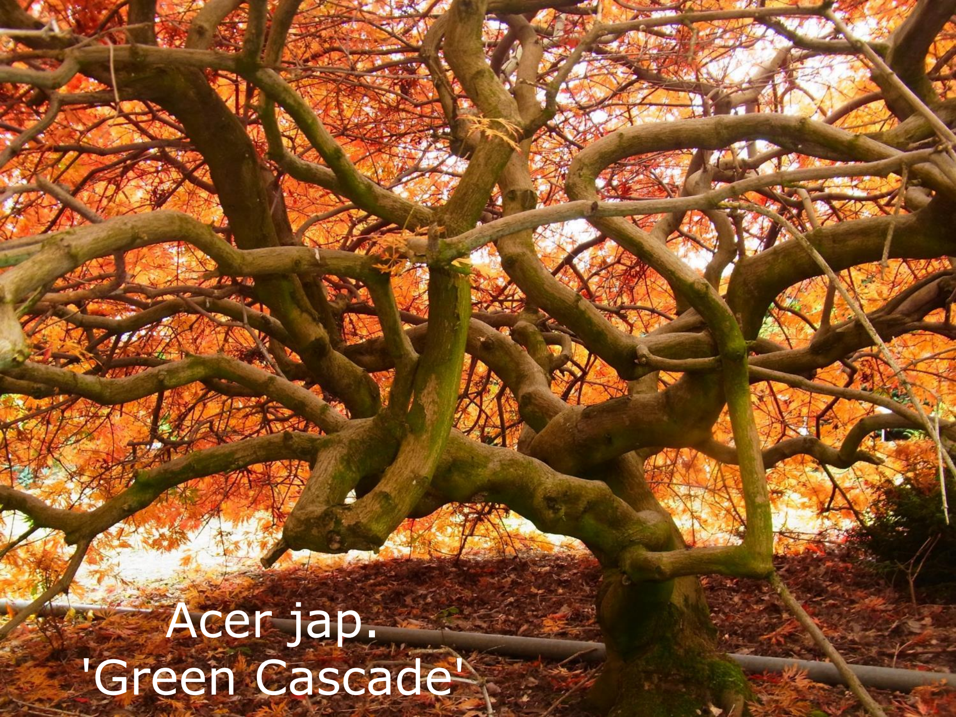
Acer jap. 'Green Cascade'