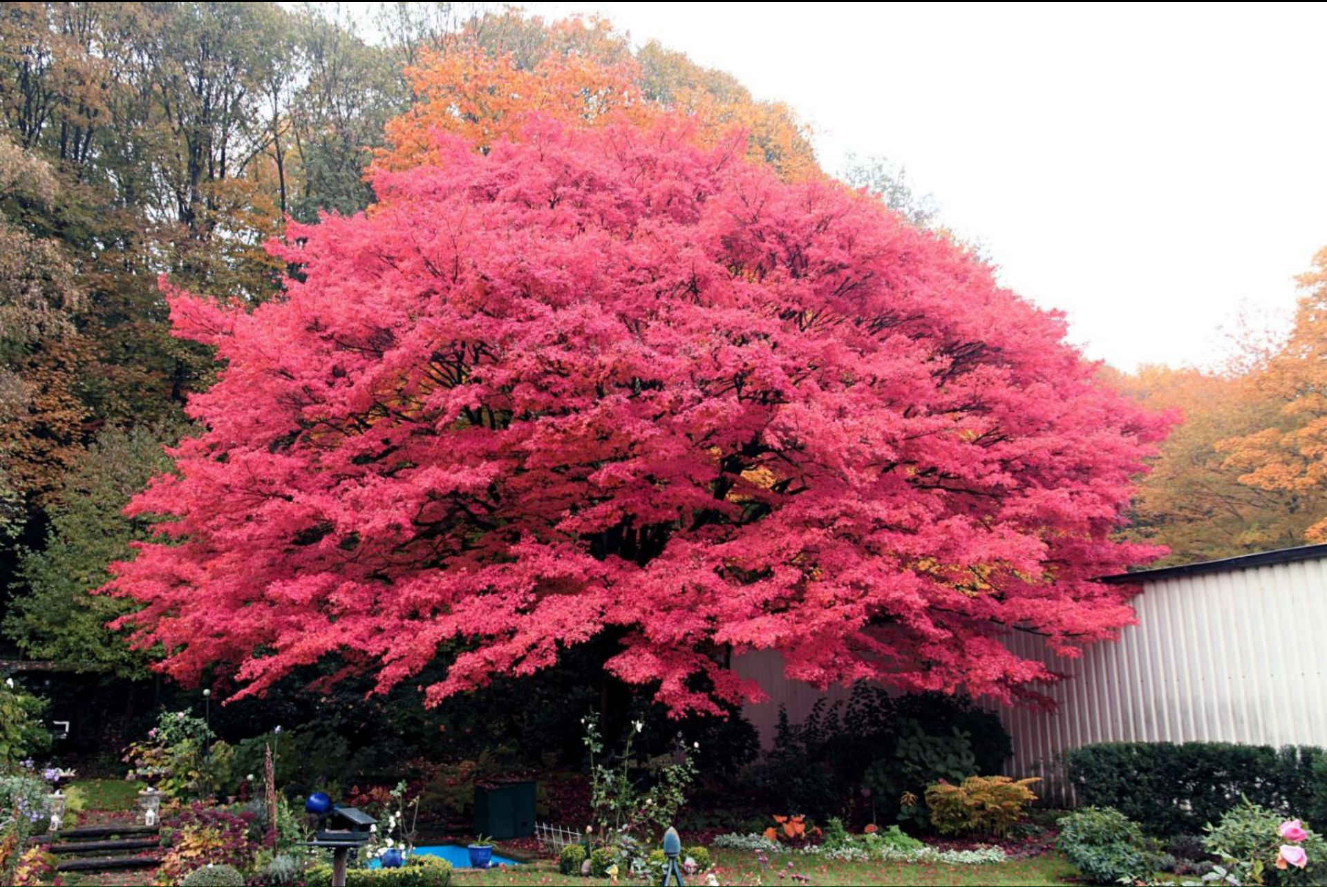
Acer palm. 'Osakazuki' 100-jährig