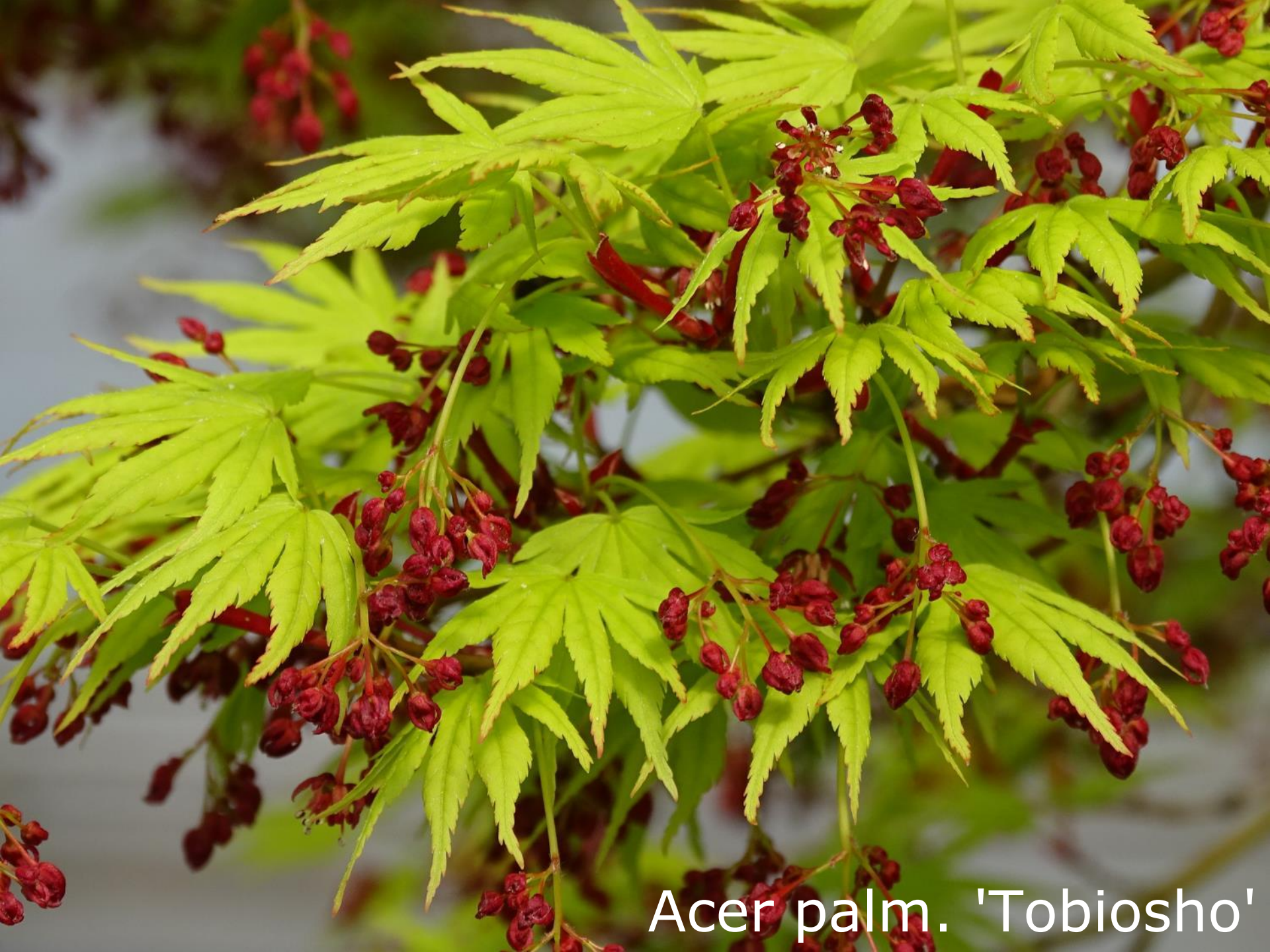
Acer palm. 'Tobiosho'