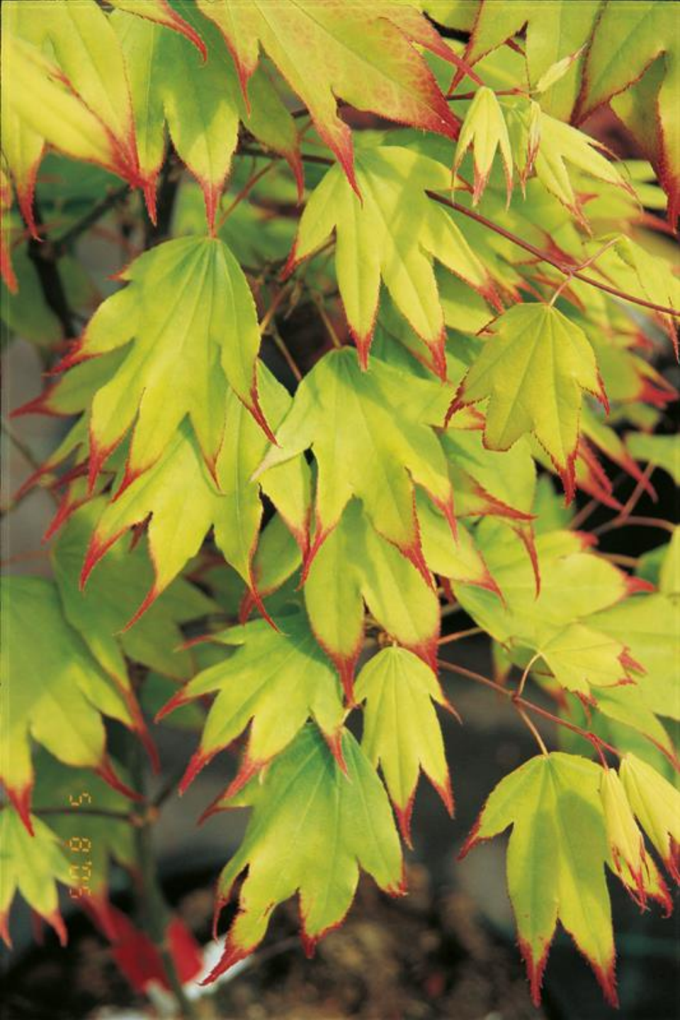
Acer palm. 'Tsuma gaki'