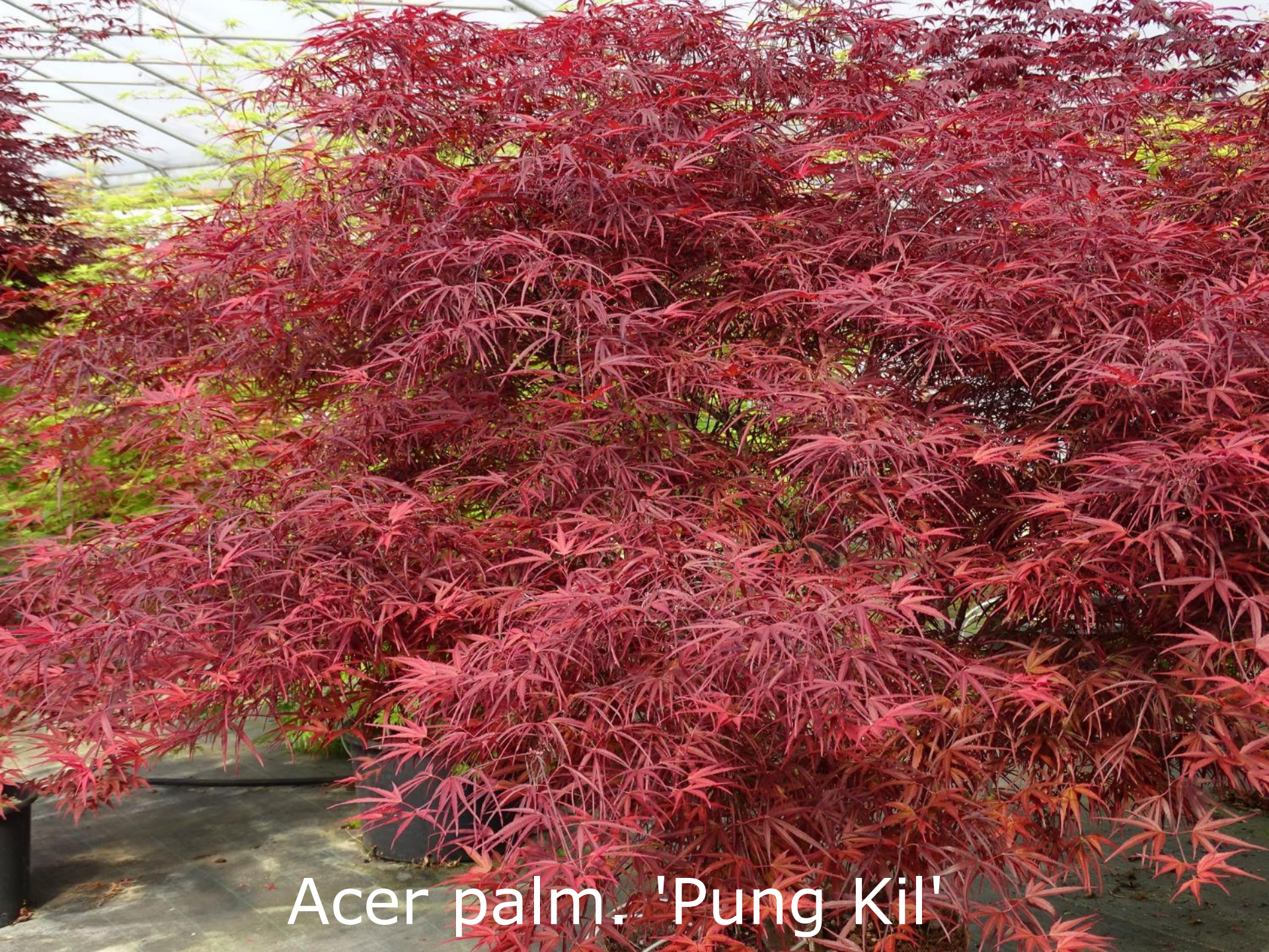
Acer palm. 'Pung Kil'