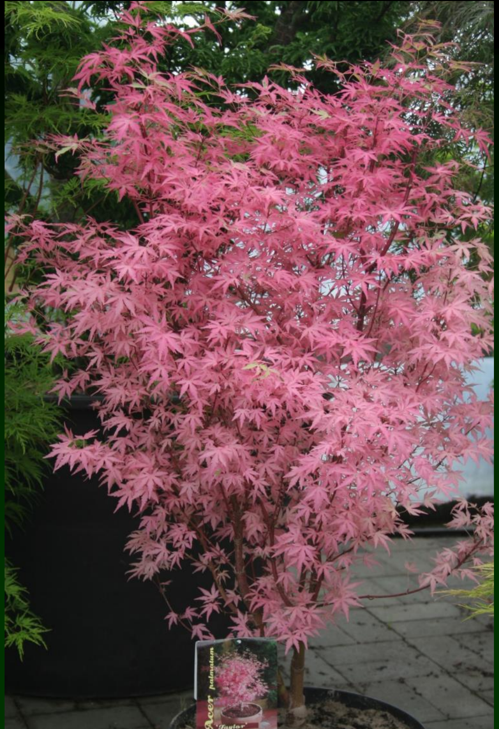
Acer palm. 'Taylor' ®