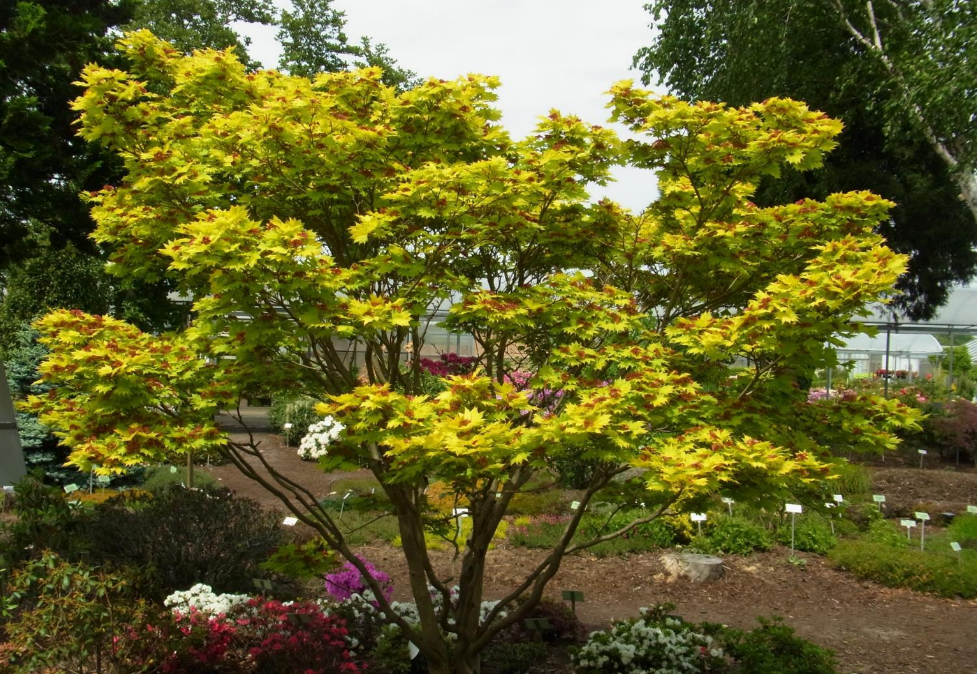
Acer shirasawanum 'Aureum'