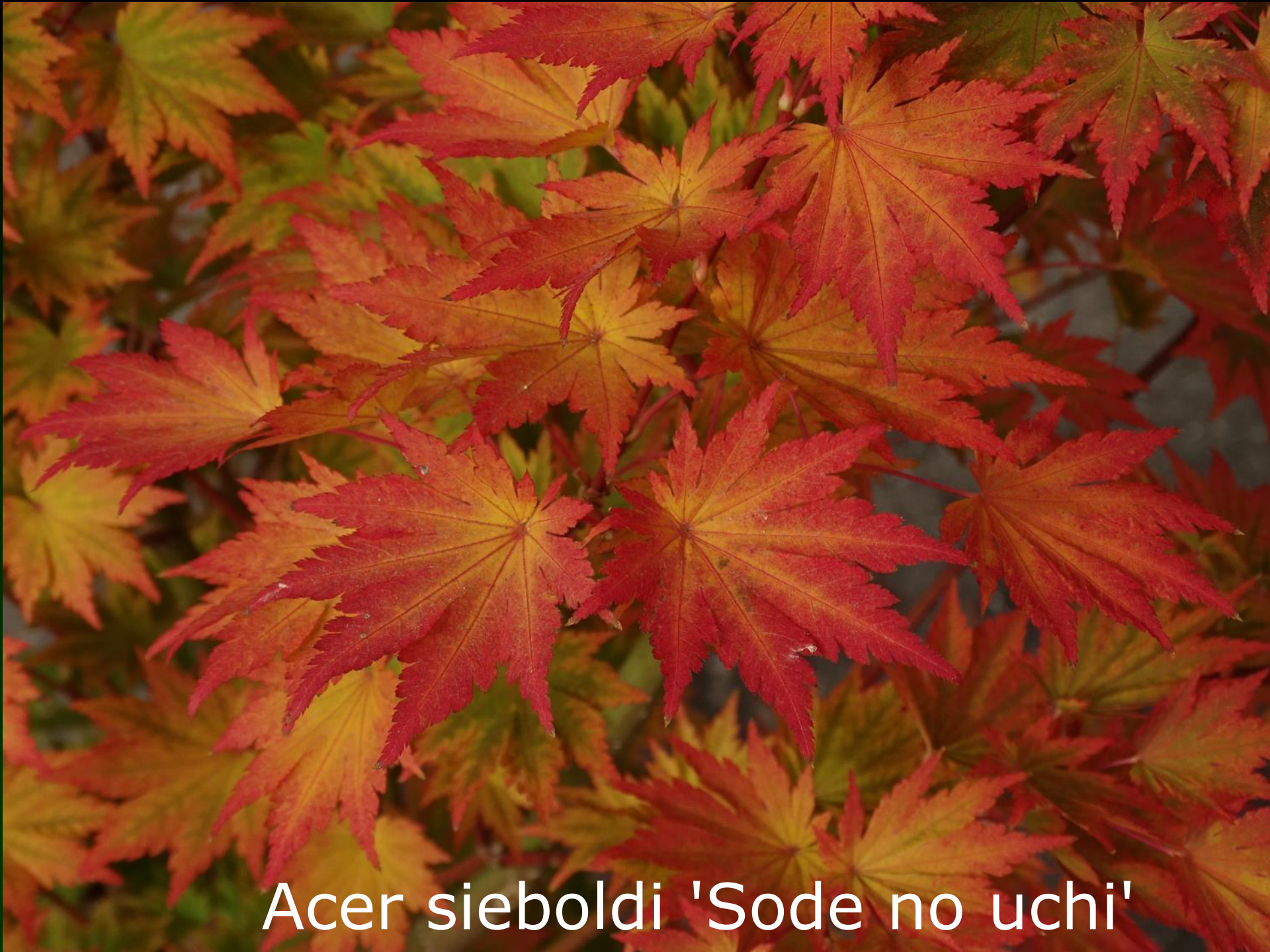
Acer sieboldi 'Sode no uchi'