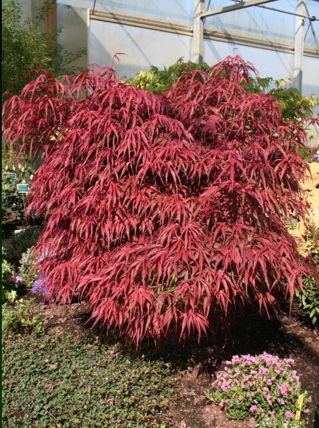
Acer palm. 'Peve Dave'