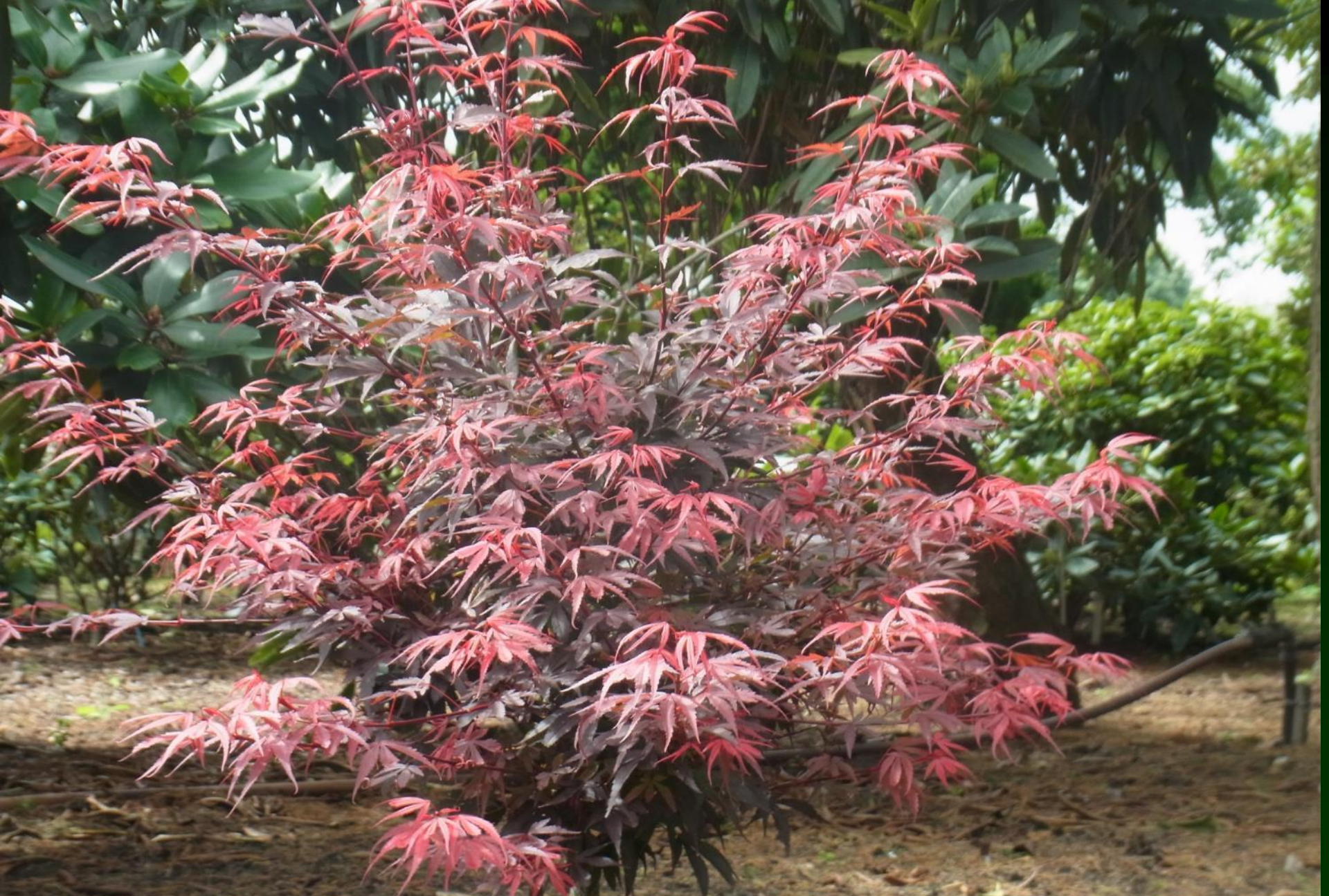
Acer palm. 'Carlis Corner Broom'