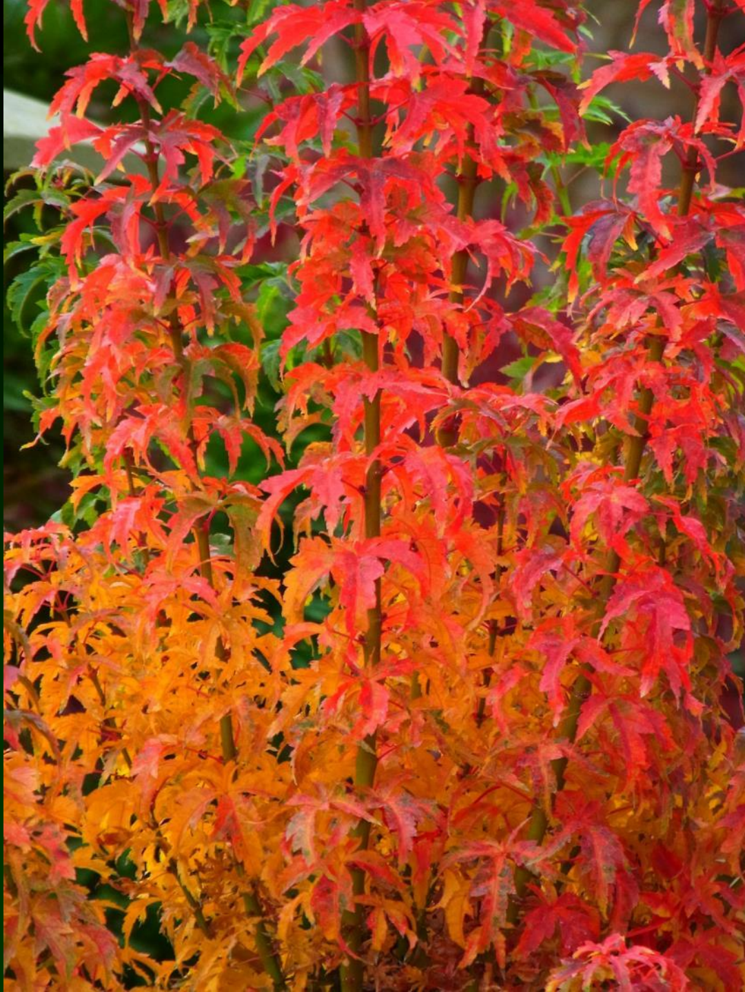
Acer palm. 'Koto hime'