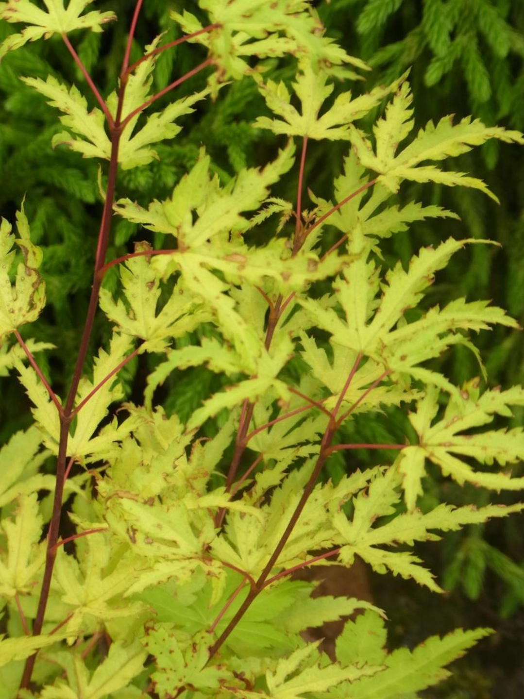
Acer palm. 'Golden Treasure'