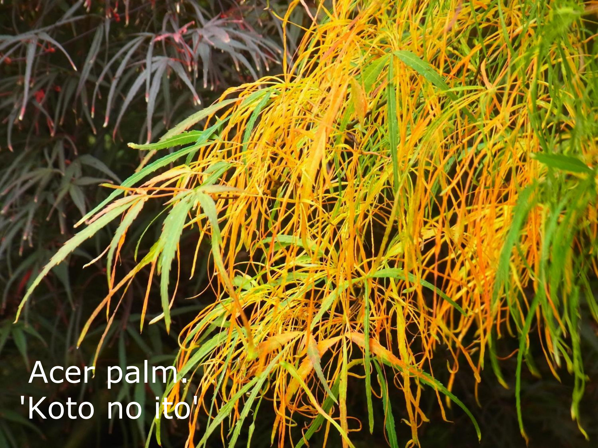
Acer palm. 'Koto no ito'