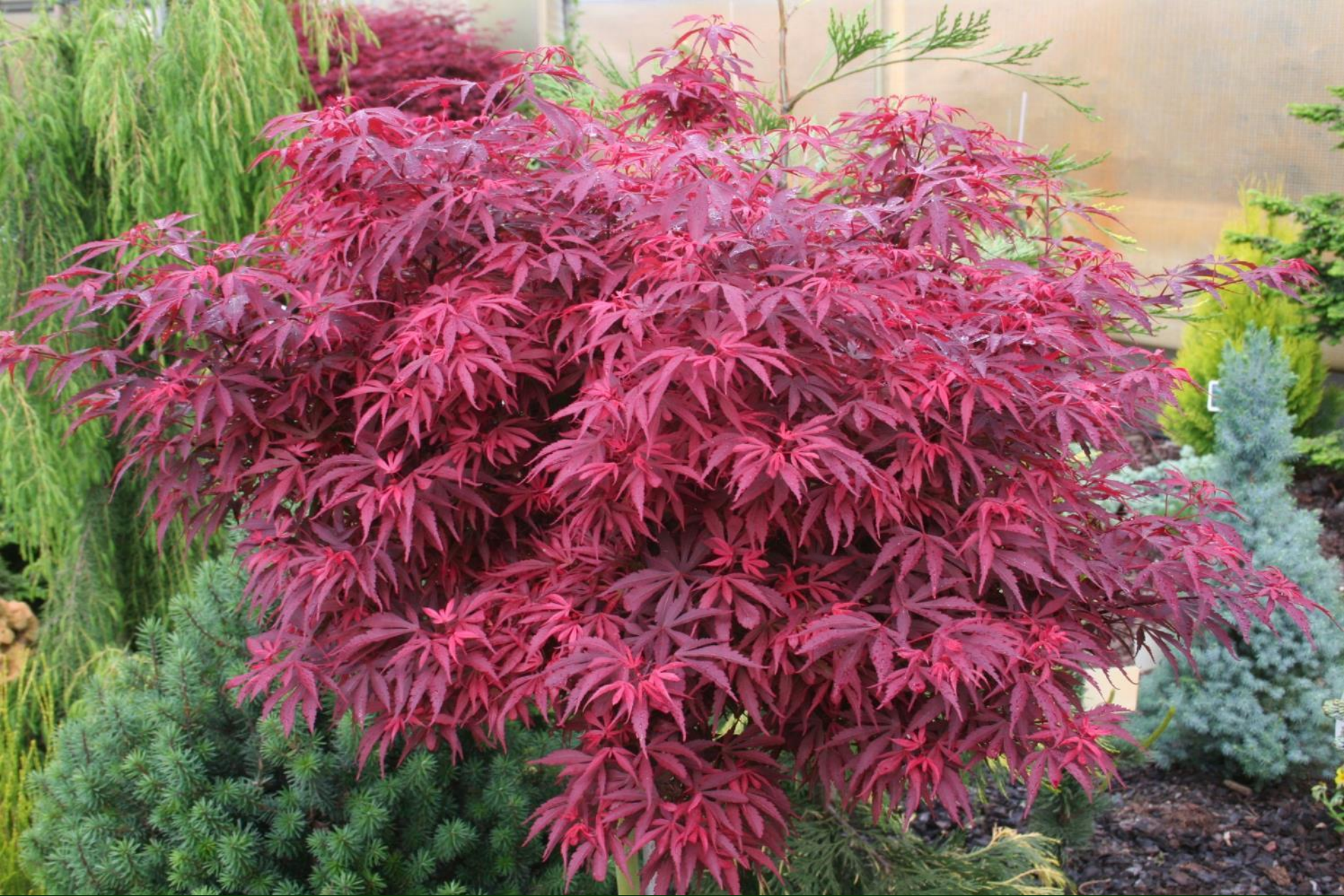
Acer palm. 'Shaina'