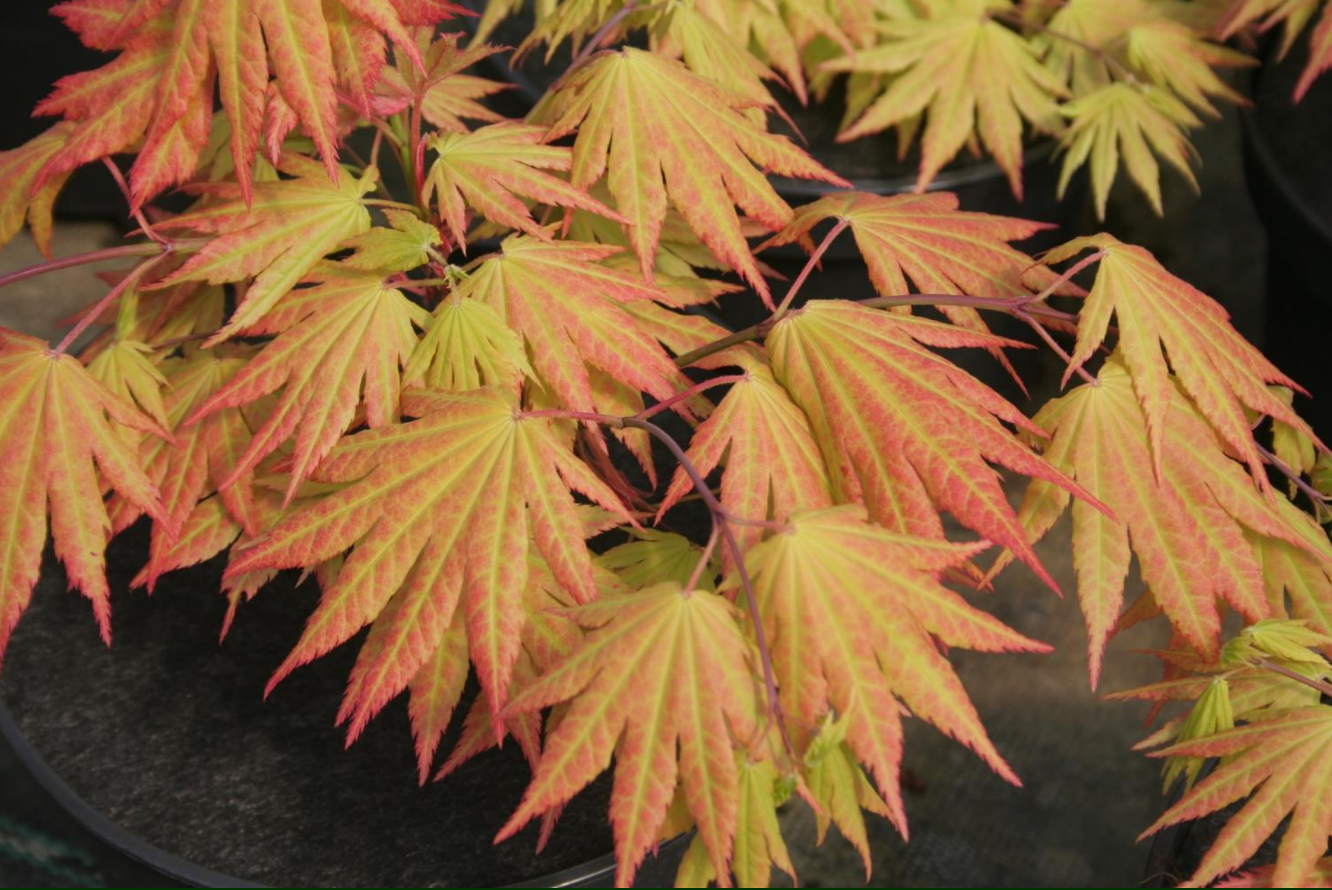
Acer shir. 'Autumn Moon'