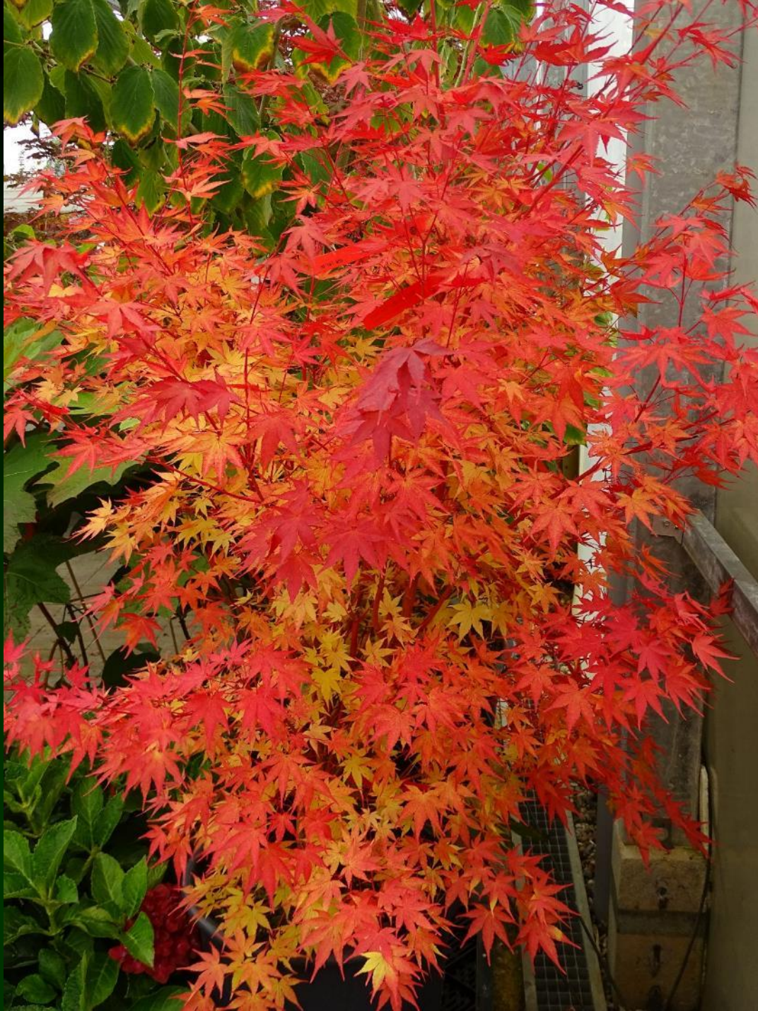
Acer palmatum 'Beni kawa'